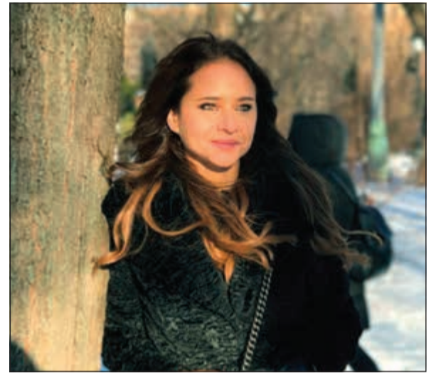
القاهرة - خلود أبوالمجد

ضمن الطفرة الجارية في تصوير مشاهد خارجية للمسلسلات في روسيا التي يشهدها الموسم الرمضاني الحالي، بدأت الفنانة نيللي كريم تصوير مشاهد مسلسلها الجديد «اختفاء»، والذي تجسد فيه شخصية استاذة جامعية تنقلب حياتها بسبب المواقف التي تقابلها، وتشهد الحلقتان الأولى والثانية من العمل ظهور نيللي وهي تدرس في إحدى الجامعات الروسية وتتحدث خلال المحاضرات باللغة الروسية، وهو بالطبع شيء لم يصعب عليها نظرا لإجادتها للغة من والدتها التي تحمل نفس الجنسية، لتجد نيللي نفسها بعد ذلك أمام أشخاص يطاردها قبل أن تعود إلى مصر.