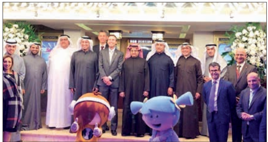
افتتاح فرع «المواشي» في كيدزانيا

أعلنت شركة نقل وتجارة المواشي، أكبر ناقل للأغنام الحية في العالم، والشركة الأولى في المنطقة لنقل وتجارة المواشي عن افتتاح «كيدزانيا» التعليمية والترفيهية، في مجمع الأقنيوز، بحضور رئيس وأعضاء مجلس الإدارة والإدارة العليا في الشركة وقيايبي كيدزانيا، وسفير استراليا لدى الكويت وسفيرنا لدى استراليا. وخلال حفل افتتاح الفرع العالمي للشركة، أشاد سفيرنا لدى استراليا بحسب الشركة بالجهود التي تقوم بها شركة نقل وتجارة المواشي من خلال مبادراتها المجتمعية التي تساهم في تعزيز ثقافة الطفل وإكسابه مهارات جديدة في مجال إنساني واجتماعي مهم. وأضاف: ان اختيار الشركة لهذا المكان يعد اختياراً ضرورياً إلى جانب نخبة مميزة من المؤسسات الاجتماعية والثقافية والاقتصادية والخيرية الكويتية التي تقدم جهوداً كبيرة في خدمة أجيال المستقبل، مشيداً بجهود رئيس مجلس الإدارة والرئيس التنفيذي للنشاط الكبير اللذين يقومان به في خدمة المجتمع. وذكر المدير، ان شركة المواشي تعتبر الناقل الدولي الأول على مستوى العالم في توفير الأغنام الحية وهو محل اعتبار وتقدير الكويت، كما يشكل إضافة نوعية لنا سواء على مستوى السفارة أو الجهاز الحكومي، إذ ان الشركة تقوم بتوفير الأمن