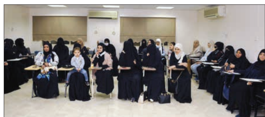
جمع من الدارسات المكرمات

جاء في الكتاب والسنة حتى تعينهن على فهم دينهن ومتطلبات حياتهن وواجباتهن