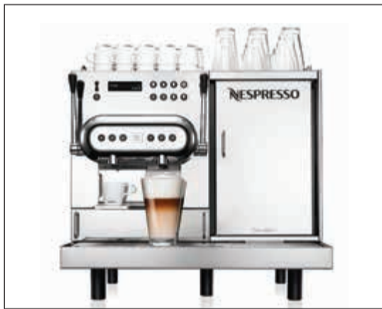
ماكينة نسبريسو Aguilu 220

نظرا للتصاعد المستمر لمتطلبات السوق التجاري، صممت ماكينة نسبريسو Aguilu 220، بشكل يلبي تطلعات جميع المنشآت التجارية الكبيرة الرائدة، مثل الفنادق والمطاعم والمقاهي والمخابز، إذ تعتبر الخيار الأمثل لتحضير أنواع القهوة بلمسة واحدة وجودة استثنائية تجعل من لحظات القهوة وقتا يصعب نسيانه. لقد تطورت ذهنية مستهلكي القهوة وتعمقت معرفتهم بها، وأصبحوا يحرصون على اختبار أصناف متميزة وجديدة منها، لذلك يرى أصحاب الفنادق والمطاعم في تقديم قهوة فاخرة فرصة للأفراد المتميز، وتأتي ماكينة Aguilu 220 عالية الأداء لتستكمل مسيرة نسبريسو في مساعدة الاحترافيين على تحقيق ذلك الهدف بأسلوب مريح وصيانة سهلة، كذلك تعزز Aguilu 220 قائمة منتجات نسبريسو الفريدة والتي تشمل مجموعة شاملة من الماكينات و13 نوعا من القهوة، وتجمع Aguilu 220 الوظائف والتصميم الأنيق