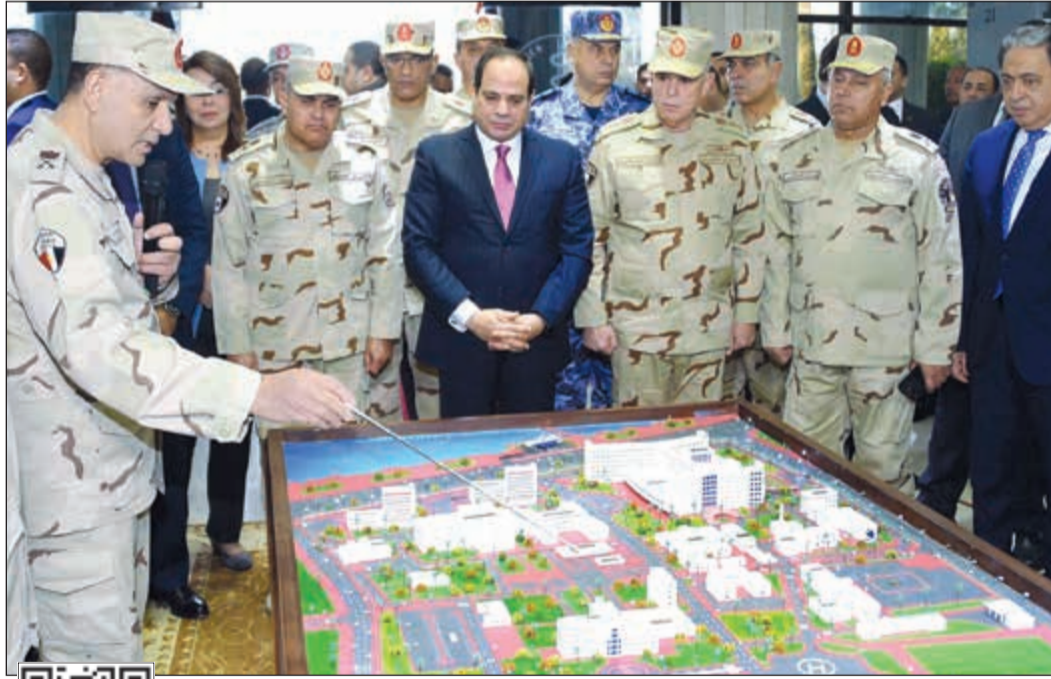
الرئيس عبدالفتاح السيسي يستمع لشرح عن أعمال تطوير وتحديث المجمع الطبي للقوات المسلحة بالمعادي

السفارة تستقبل راغبى تسجيل تأييدهم لمرشحي انتخابات الرئاسة