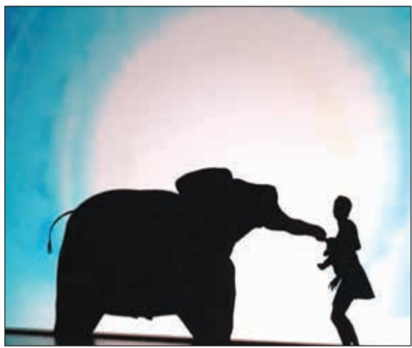
تجسيد الفيل بأجسام أعضاء الفرقة

الزواج حتى الأمومة. وتشكلت أذرع الراقصين لتصنع طقس الزفاف أو نوافذ المنزل الذي يغدو بيت الزوجية حتى شعر الأم المجهد يتحول الى شجرة يقارحج عليها طفلها وتم ذلك كله بأداء بالغ الاحترافية والإتقان صنع من خلاله الممثلون بإيديهم وأجسادهم تكوينات باهرة. الجميل في عرض «كاتابولت» في مركز الشيخ جابر الأحمد الثقافي تلك اللوحة الجميلة التي رسمتها أجسادها لتقديم تهنئة للكويت وأهلها بمناسبة رفع الإيقاف الرياضي عنها فقدموا لوحة جميلة للعديد من الألعاب الرياضية مثل كرة القدم والملاكمة والرماية والسلة بحركات تعبيرية أنهلت الجميع كبارا وصغارا لتنتهي تلك اللوحة بظهور علم الكويت ليضج المسرح بتصفيقا مدويا لأعضاء الفرقة على هذه التهنئة الجميلة.