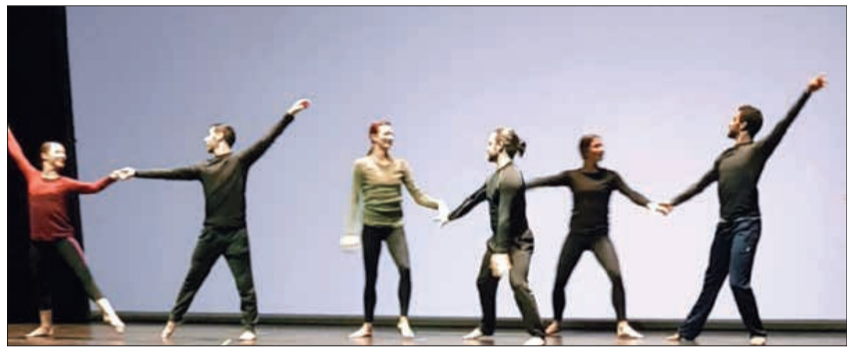
أعضاء فرقة «كاتابولت»

وفي فقرة «محطات» استعرضت الفرقة أهم المراحل في حياة الإنسان من الطفولة المبكرة حتى عمر النضج واستخدم القائمون على العرض الفن بالشكل الذي جعله الوسيلة المثلى للتعبير عن المشاعر العميقة للمراحل