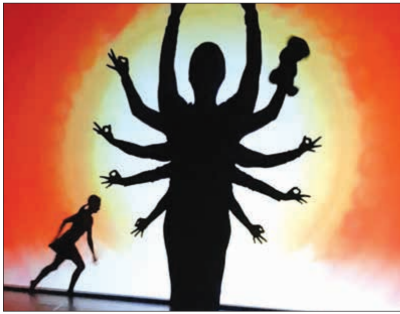
من الفقرات الجميلة في العرض