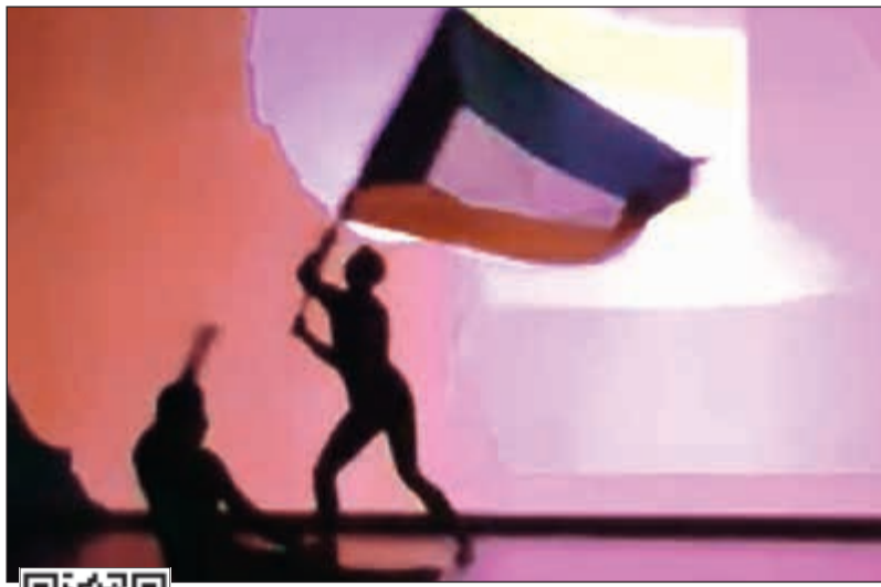
علم الكويت في عرض «كاتابولت» بمركز جابر الأحمد الثقافي