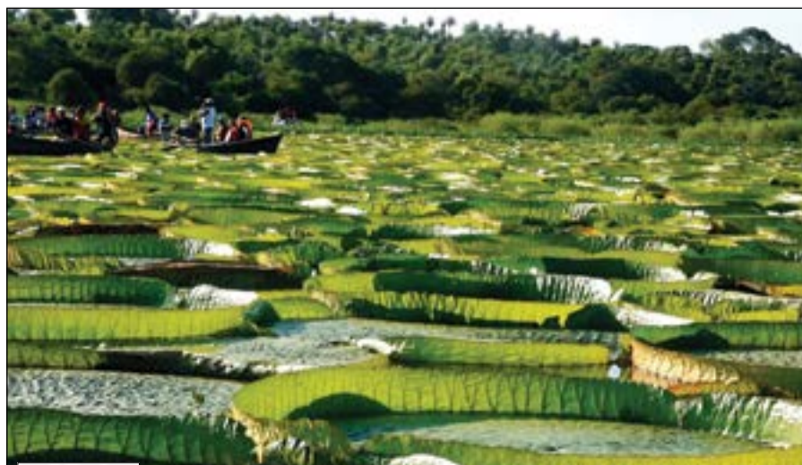
نباتات نيلوفر العملاقة.. معلم سياحي في پاراغواي