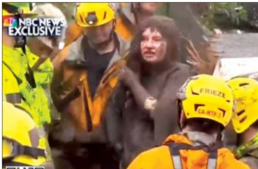
الفتاة بعد إنقاذها