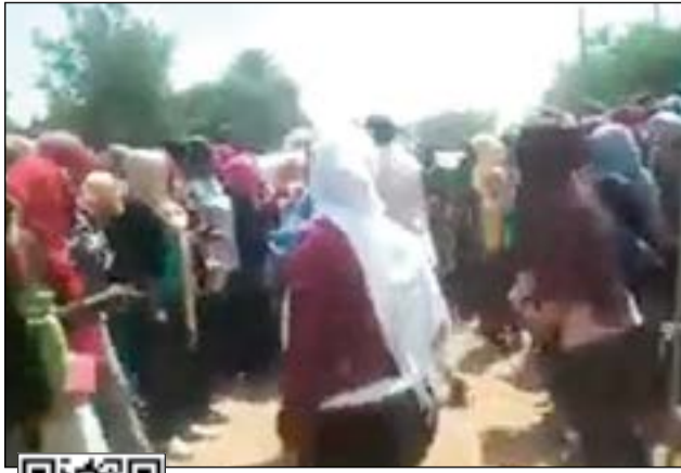
لقطتان من الفيديو المتداول تظهران رئيس الجامعة لدى اعتدائه على إحدى الطالبات وجانباً من المظاهرات

أ.ف.ب: عبر مستخدمو مواقع التواصل الاجتماعي عن غضبهم مع انتشار شريط مصور يظهر رئيس جامعة للبنات في الخرطوم يضرب طالبتين بعد تظاهرة للطلاب احتجاجاً على ارتفاع أسعار الوجبات في مقاهي الجامعة. وظهر في الشريط قاسم بدري رئيس «جامعة الأحفاد للبنات» وهو شخصية بارزة في السودان ومعروف بدفاعه عن حقوق المرأة، وهو يصغف طالبة ويضرب أخرى تكرر. عندما تحلقت طالبات حوله داخل الجامعة وقامت إحداهن بضربه في حين هتفت الباقيات وهن يرفعن أيديهن تجاهه.