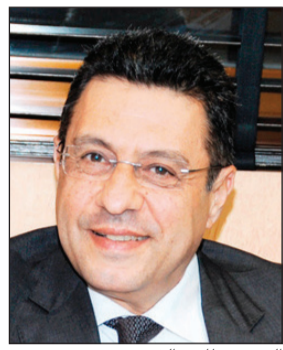
السفير طارق القوني