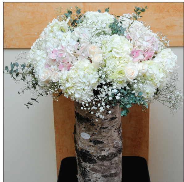
زهور من النائب عمر الطبطبائي في عيد «الأنباء»

تبوأ «الأنباء» مرتبة الصدارة نتيجة الالتزام المهني الرفيع بمبادئ العمل الصحفي المخلص، وحققت إنجازات ملموسة في الابتكار والإبداع، وأشارك تقنية التواصل الإعلامي لخدمة القراء والجمهور إلى ابدع مدى.