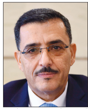
السفير د.علي منصور بن سفاق