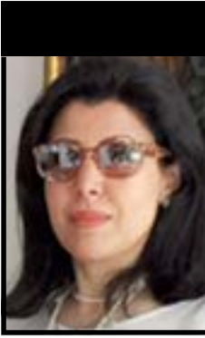
الشيخة حصة الحمود السالم الحمود الصباح

والعلم والثقافة والأخلاق. رسالة عاجلة لأبنائنا بعدم الانخراط وراء هذه الثقافة الزائفة وتوجيه لأولياء الأمور بتحذير أبنائهم من هذا الخطر العظيم، كما يجب على المسؤولين وخاصة في الأجهزة الإعلامية الحد من نشر هذه الثقافة في جميع الأجهزة والزام الإعلاميين من مذيعين وممثلين ومقدمي برامج بعدم استخدام هذه الكلمات والمصطلحات.