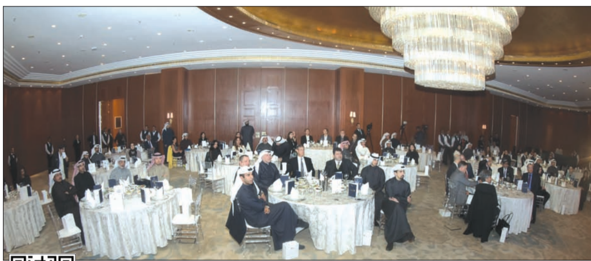
جانب من الحضور في الحفل

أوسبورن: شراكتنا مع مؤسسة «التقدم العلمي» نموذج بارز بكيفية إحداث تغيير إيجابي