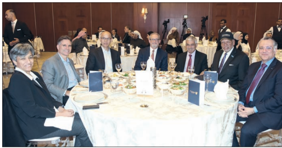
السفير لورانس سيلفرمان ود.عدنان شهاب الدين