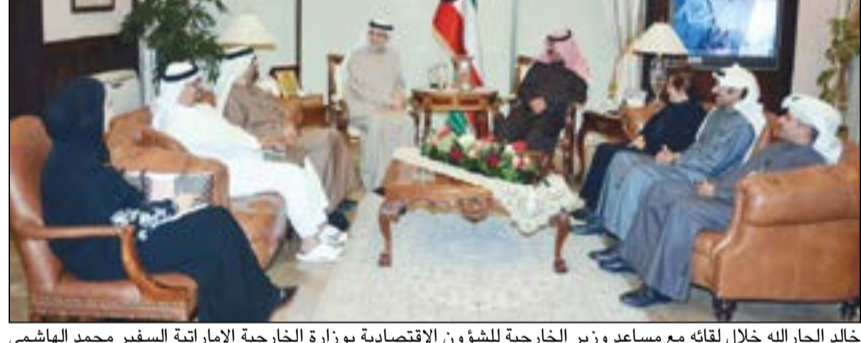
خالد الجارالله خلال لقائه مع مساعد وزير الخارجية للشؤون الاقتصادية بوزارة الخارجية الإماراتية السفير محمد الهاشمي

اجتمع نائب وزير الخارجية خالد الجارالله أمس مع مساعد وزير الخارجية للشؤون الاقتصادية بوزارة الخارجية والتعاون الدولي في دولة الإمارات العربية المتحدة الشقيقة السفير محمد الهاشمي الذي يقوم بزيارة للبلاد والوفد المرافق له. وتم خلال اللقاء بحث عدد من أوجه العلاقات الثنائية بين البلدين خاصة ما يتصل منها بالمجالات الاقتصادية والاستثمارية إضافة الى تطورات الأوضاع على الساحتين الإقليمية والدولية. حضر اللقاء مساعد وزير الخارجية للشؤون الاقتصادية السفارة أمل الحمد ومساعد وزير الخارجية لشؤون مكتب نائب الوزير السفير أيهم العمر.