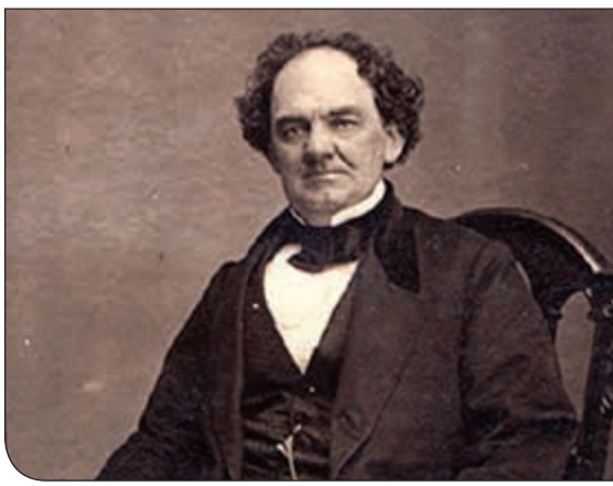
بي تي بارنوم الحقيقي