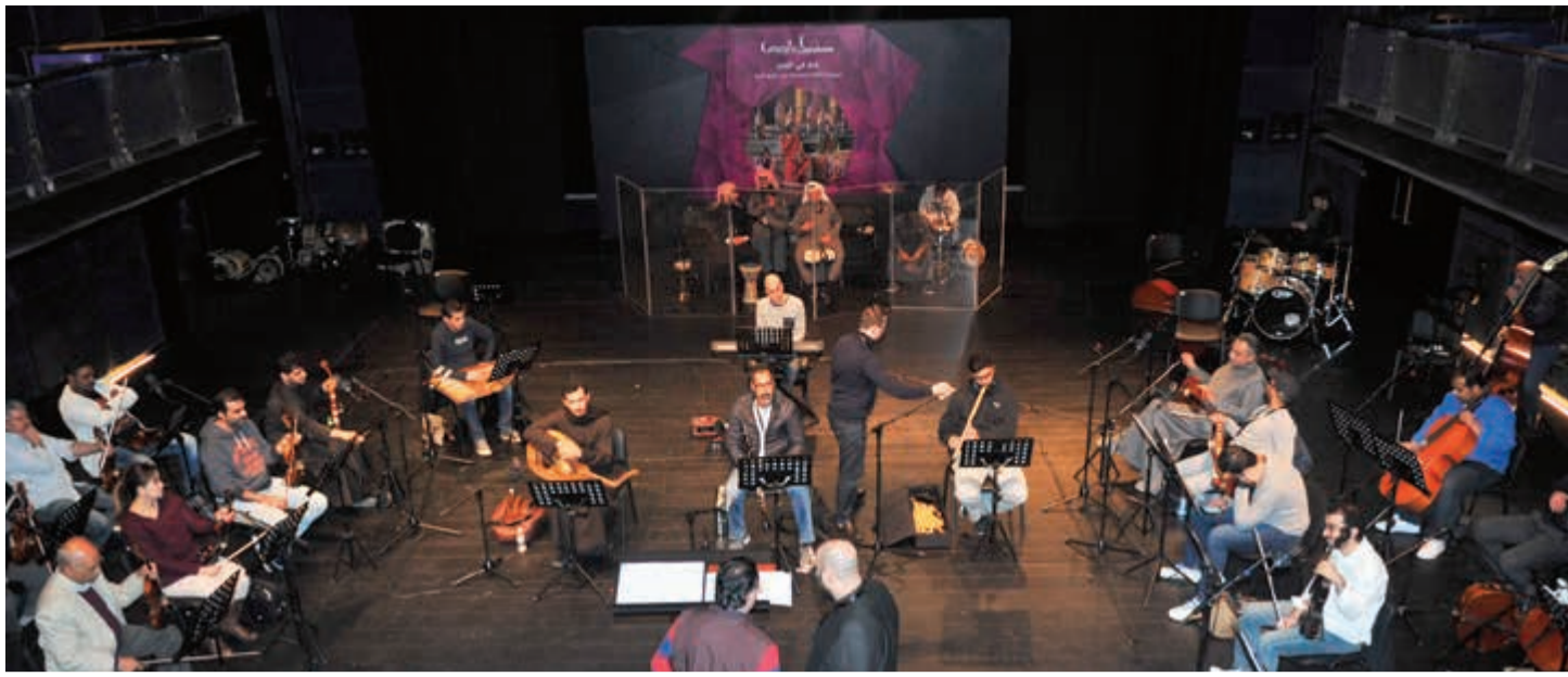
جانب من بروقات ليلة «الحن راشد الخضر»

يقيمها مركز الشيخ جابر الأحمد الثقافي في 26 الجاري