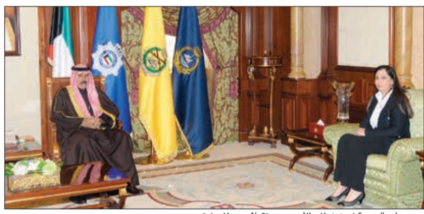
سمو ولي العهد الشيخ نواف الأحمد مستقبلاً د.رولا دشتي