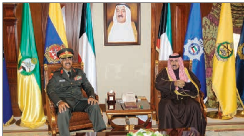
سمو ولي العهد الشيخ نواف الأحمد مستقبلاً الفريق ركن محمد الخضر

استقبل سمو ولي العهد الشيخ نواف الأحمد بقصر بيان صباح أمس سمو رئيس مجلس الوزراء الشيخ جابر المبارك. واستقبل سمو ولي العهد الشيخ نواف الأحمد بقصر بيان أمس رئيس الأركان العامة للجيش الفريق ركن محمد الخضر