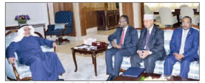
الشيخ علي الجراح مستقبلاً وزير التخطيط الصومالي جمال محمد حسن والوفد

تسلم صاحب السمو رسالة خطية من الرئيس محمد عبدالله محمد فرماجو رئيس الصومال الفيدرالية الشقيقة تضمنت العلاقات الثنائية التي تربط البلدين والشعبين الشقيقين وسبل تعزيز العلاقات في