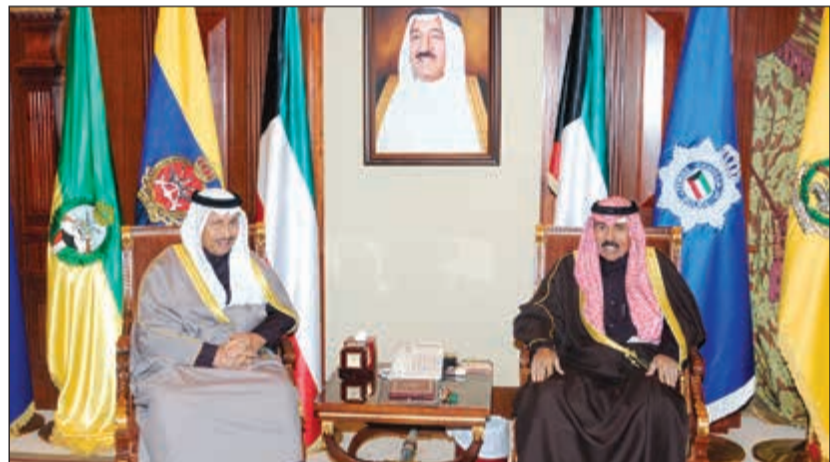
سمو ولي العهد الشيخ نواف الأحمد مستقبلاً سمو رئيس مجلس الوزراء الشيخ جابر المبارك

وعددًا من كبار القادة في الجيش، وذلك إثر حادث الهبوط الاضطراري للمروحية التي كانت تقلهم بجمهورية بنغلاديش الشعبية. كما استقبل سمو ولي العهد الشيخ نواف الأحمد بقصر بيان أمس د.رولا عبدالله دشتي.