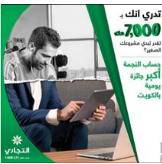
للمعملاء الفوز بجوائز كبرى تمكنهم من تحقيق جميع أحلامهم تبدأ من 100 ألف دينار

للمربع الأول ثم تزيد بمعدل 50 ألف دينار لكل فترة فصلية لتصل إلى 250 ألف دينار في الربع الأخير من العام. هذا، ويمكن للعميل التمتع بالمزاي الإضافية التي يوفرها حساب النجمة وهي الحصول على بطاقة سحب آلي، والحصول على بطاقة ائتمان بضمان الحساب، والتمتع بجميع الخدمات المصرفية التي يوفرها البنك، والبنك التجاري الكويتي إذ يهنئ جميع الفائزين في سحب النجمة فإنه يسترعى انتباههم بأنه سيتم قيد الجوائز النقدية في حساباتهم لدى البنك، وبمضي الوقت نفسه دور وزارة التجارة والصناعة وتعاونها الدائم وإشرافها الفعال على عمليات السحب التي تمت بسلاسة وشفافية.