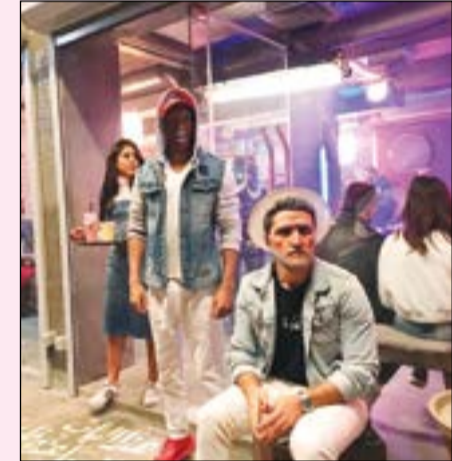
مشهد من الفيديو كليب

وعن العمل الجديد والذي طرح الساعات القليلة الماضية على «يوتيوب» قال المخرج اسلام مهنا في تصريح لـ «الأنباء»: «فكرة الكليب مختلفة وقد قمنا بتصويره بكاميرا واحدة «وان شوت»، حيث درات الكاميرا مرة واحدة ولم تتوقف حتى انتهينا من الأغنية، وهو «تكنيك» في الشغل صعب جدا، لكن الحمد لله خرج العمل كما اردنا