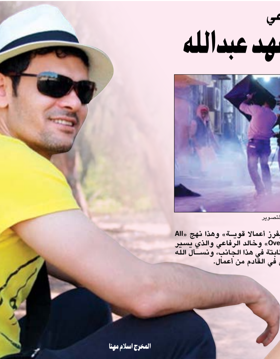
المخرج اسلام مهنا

الإنتاجي، وقد سخرت إمكانياتها وذلك العقبات لتقديم عمل فني يليق بمكانتها، وخالد الرفاعي كمنتج بذل معظم الميزانية في الإنتاج لدرجة انه استقدم خصيصا للكليب مدير تصوير من جورجيا مع استخدام الكاميرا «البيكس» وهي الأعلى كواليتي في العالم، وكل ذلك للظهور بصورة تتال رضا الجمهور وترسخ فكرة أن «الإنتاج