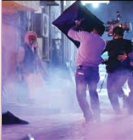
من اجزاء التصوير