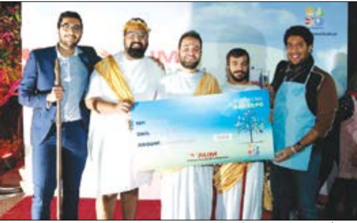
تكريم أحد الفرق الفائزة في الأنشطة