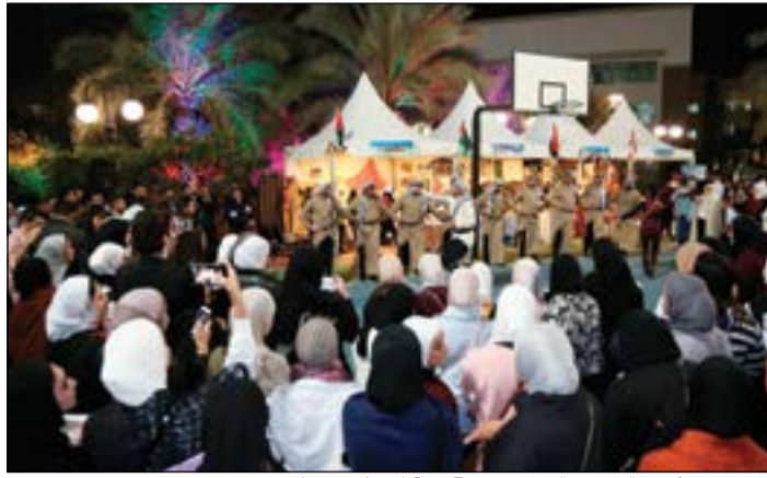
جانب من الأنشطة المتنوعة خلال «International Day Expo»

وتتسعى AUM من خلال الفعاليات الثقافية لإثارة المجال أمام طلابها لتوسيع آفاقهم الثقافية وتقدمهم نحو إغناء تجربتهم ومعرفتهم، وتزودهم بالقدرة على تقبل أساليب أخرى من الحياة وأنماط مختلفة في السلوك والفكر.