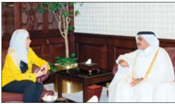
د.جنان بوشهري مستقبلة الوزير جاسم السليطي

كشفت وزيرة الدولة للشؤون الإسكان ووزيرة الدولة للشؤون الخدمات الكويتية د. جنان بوشهري أمس الإثنين مع وزير المواصلات والاتصالات القطري جاسم السليطي تعزيز التعاون المشترك. وقالت وزيرة «الخدمات» في بيان صحفي إن بوشهري بحثت لدى استقبالها الوزير السليطي والوفد المرافق سيل تنمية العلاقات الثنائية بين البلدين وتعزيز التعاون في مجالات عدة لاسيما المعنية بخطط التنمية الوطنية. ونقل البيان عن بوشهري تأكيدها على مائة العلاقات الاجتماعية والاقتصادية والتاريخية بين البلدين وحرص الكويت على الارتقاء وتعزيز العلاقات بما يخدم المصالح