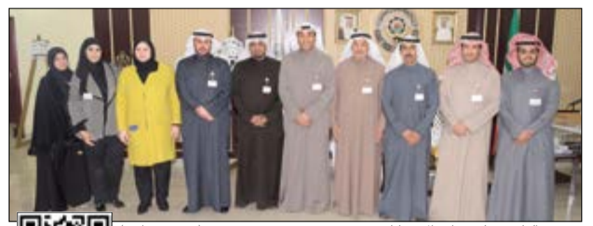
عدد من القائمين على تنظيم الانتخابات يمكن استخدام QR كود أو مشاهدة الفيديو

2018، موضحا أن الجمعية العمومية العادية صادقت على التقريرين المالي والإداري للمجلس السابق. وأشار إلى أنه في الساعة التاسعة صباحا تم افتتاح عملية التصويت بمشاركة الناخبين، موضحا أن العملية سارت بشكل منظم من خلال أربع لجان داخل مبنى الاتحاد العام لعامل الكويت. وأثنى العرادة على دور الجمعية العمومية على وقتهم في مجلس إدارة الاتحاد العام من خلال التصديق، مشيدا