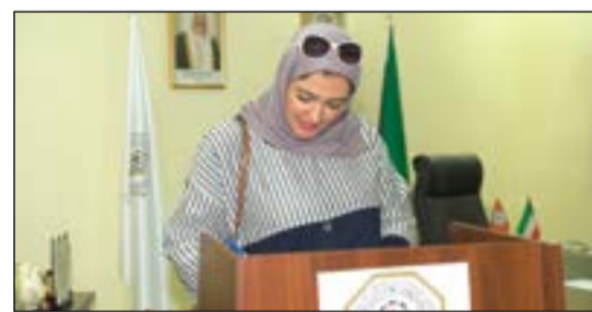
ناخبة تدلي بصوتها

أسامة ابوالسعود انطلقت صباح أمس انتخابات نقابة العاملين بوزارة التربية في مقر الاتحاد العام لعامل الكويت، بحضور متوسط خلال الفترة الصباحية، وسط توقعات بأن يتوافد المقترون على الصناديق بعد فترة العصر، خصوصا أن الفترة الصباحية الغالبة لديها التزام في ساعات العمل. وشهدت الانتخابات وجود مقر انتخابي آخر في مقر اتحاد نقابات العاملين بالقطاع الحكومي، الأمر الذي قبله الاتحاد العام بإنابة حالة بمخفر ميدان حولي للتجاوز والتدخل في انتخابات نقابة التربية. بدوره، قال سكرتير عام الاتحاد العام لعامل الكويت محمد العرادة: يعد يوم الانتخاب عرسا ديموقراطيا لنقابة العاملين في وزارة التربية للدورة الانتخابية