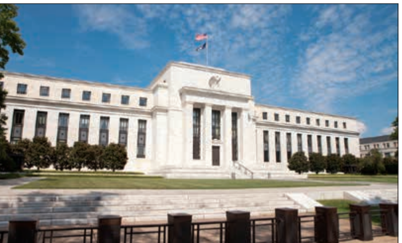
مجلس الاحتياطي الفيدرالي الاميركي

قال تقرير بنك الكويت الوطني إن الدولار بقي منخفضاً في الأسبوع الأول من 2018 مع عودة الأسواق إلى أسس الاقتصاد الأمريكي عقب الانتهاء من الخطة المالية الضريبية. وبالرغم من أن التوظيف كان قريباً من مستوى التوظيف الكامل في غالب عام 2017، فإن التضخم بقي منخفضاً لدى إزالة تأثيرات أسعار النفط، وتراجع فعلياً مؤشر التضخم المفضل لدى المجلس الفيدرالي - مصروفات المستهلك الشخصي الأساس - من 1.9٪ إلى 1.5٪ على مدى السنة، فيما سجلت آخر قراءة للتضخم الكلي 2.2٪. ومع ذلك، بقيت أغلبية أعضاء اللجنة الفيدرالية للسوق المفتوح على اعتقادها أن البطالة المنخفضة ستؤدي لاحقاً إلى ارتفاع معدل التضخم. وأضاف التقرير أن محاضر اجتماع اللجنة الفيدرالية للسوق المفتوح في ديسمبر لم تتمكن من تحريك الأسواق. واحتوت المحاضر على القليل من المفاجآت وجاءت كما كان متوقفاً، حيث كررت المحاضر إفادة اللجنة بتوقع إيجابي للاقتصاد وبنان المزيد من الرفع التدريجي في معدل الفائدة على الأموال الفيدرالية سيكون «مبشراً» لتحقيق الهدف الثنائي للجنة بتوظيف أقصى وتضخم قريب من 2٪. والأهم من ذلك أن واضعي السياسات