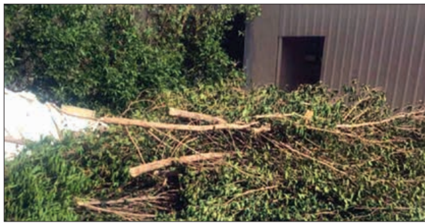
إزالة أشجار تتسبب في حجب الرؤية

قامت النوبة «أ» من فريق طوارئ بلدية مبارك الكبير برفع وإزالة 60 إعلاناً مخالفاً بمختلف الأحجام، وتضمنت الحملة توجيه إندارين لإزالة حجب الرؤية ومخالفة بناء وطلب إحضار تراخيص مخطط البناء.