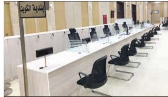
مركز الخدمة إنجاز استعداده لتنفيذ الرخص الإلكترونية