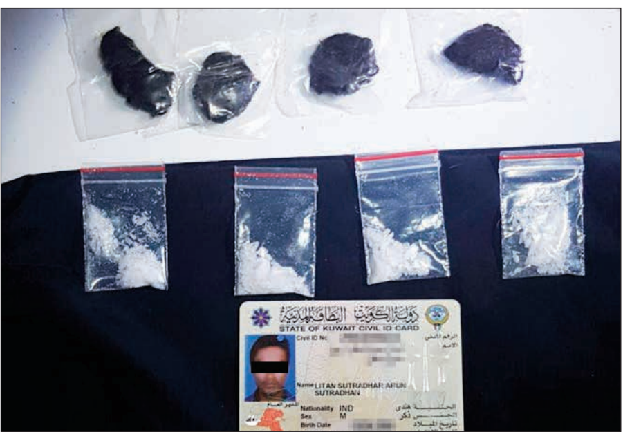
اكياس الشبو وقطع الحشيش التي تم التحفظ عليها

أحال رجال أمن الفروانية فتاة وشابين عثر عليهم في