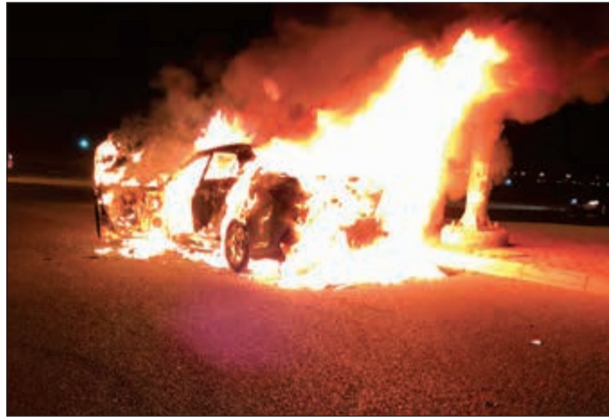
المركبة أثناء احتراقها