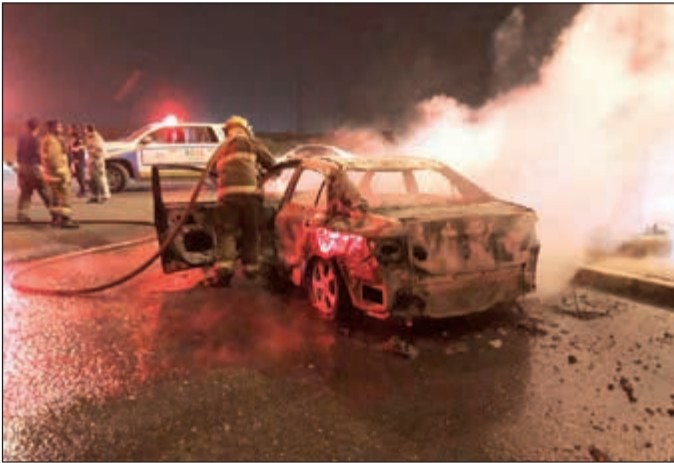
... واثنا أخماد النيران