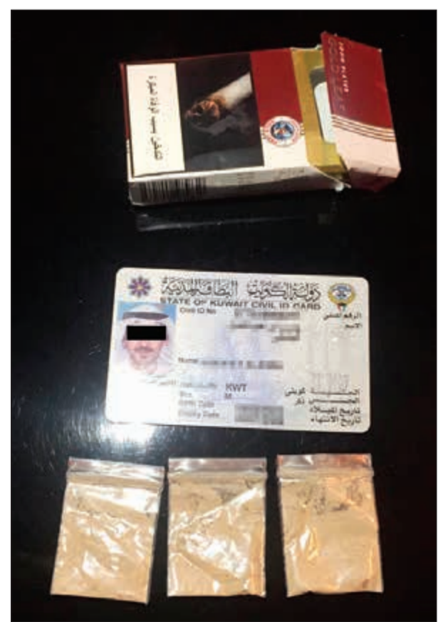
الهيروين الذي عثر عليه بحوزة المواطن