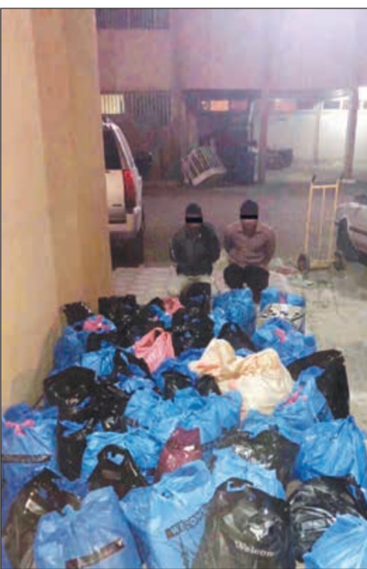
المتهمان وامامهما الاكياس التي تحتوي على الخمر