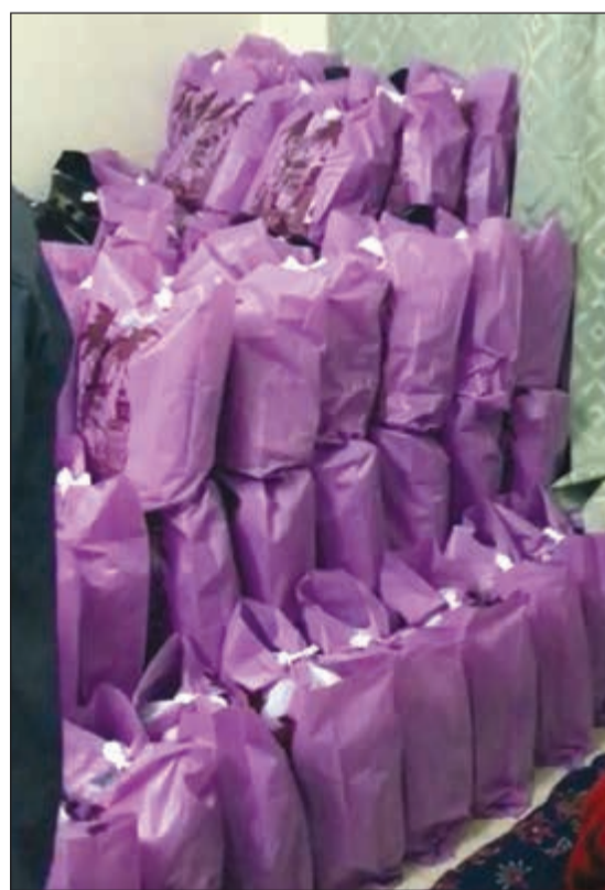
.. وتغليف الخمر بأكياس هدايا

وأضاف المصدر ان رجال الأمن قاموا بضبط وافد أسبوي أيضا وبحوزته عدد من قناني الخمر المحلية في منطقة الجليل، وعليه تم رفع تقرير بالواقعتين.