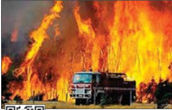
حرائق الغابات خرجت عن السيطرة