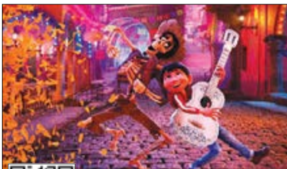
لقطة من فيلم «كوكو»