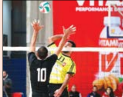
تحذ وقوة في مباراة البوشرية ورياضي حبوب