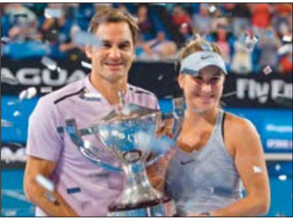
السويسري روجيه فيدرر ومواطنته بليندا بينيسيتش يحملان الكأس

وافتتح الخضر جيمس ميلنر التسجيل للفيقربول (35 ركلة جزاء). وأدرك الإسكتلندي الدولي غيلفي سيغوردسون التعادل للتوفيز