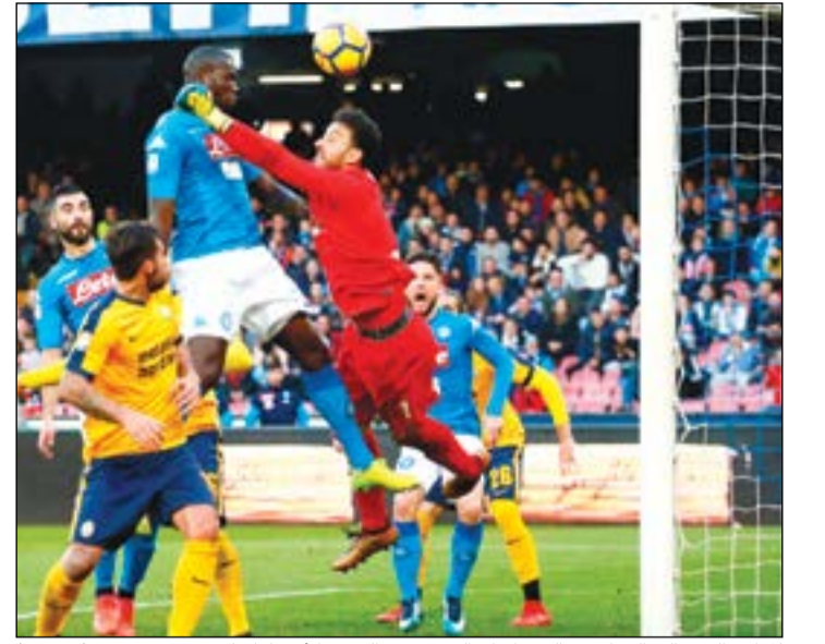
الدافع السنغالي العملاق خاليدو كوليبالي يسجل الهدف الأول لنابولي

نابولي كان يتطلع إلى الفوز لثانيه متتاليه في الدوري الإيطالي، ولكن في مباراة صعبة أمام ميلان، حيث تمكن لاعبي ميلان من إحراز هدفين في الشوط الأول، مما جعل المباراة متعادلة 1-1. ومع ذلك، تمكن لاعبي نابولي من إحراز هدفين في الشوط الثاني، مما جعلهم يفوزوا 3-1. وكان كوستا كوستا العائد حديثا ثاني ترتيب الدوري خلف برشلونة، يخوض مباراته الأولى في الليغا، بعدما شارك في المباراة ضد ليدوا أسبورتو (0-4) في مسابقة الكأس هذا الأسبوع، وسجل هدف وقلب فنيالسا الثالث تأخره بهدف أمام ضيفه جيرونا إلى فوز 2-1 على ملعبه «ميسيتايا» أمام 27749 متفرجا، ليعيد فارق النقاط مع اتلتيكو الثاني.