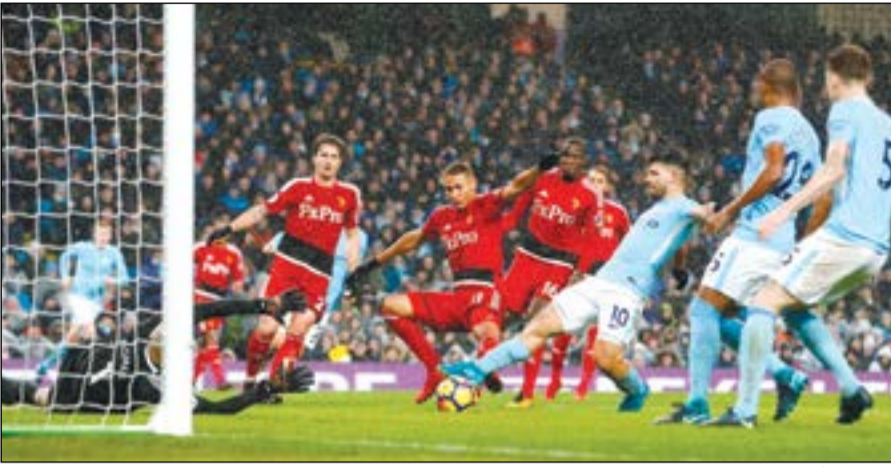
سيرخيو أغويرو يسجل في شبك بيرنلي (رويترز)

بتسديدة من مشارف المنطقة (67). لكن الكلمة الأخيرة كانت لقان ديبك الذي تصدى لكرة برأسه ليودنر فوردي وانتظر حتى الدقائق الست الأخيرة ليرفع فريقه قبل نهاية المباراة بست دقائق. وفي المقابل، استخفاف مان يوناييتد دربي كاوتني من الدرجة الأولى على ملعب اولدترافورد وانتظر حتى الدقائق الست الأخيرة ليخرج فائزاً 2-0. وأضاع «المان» كما هائلا من الفرص، علما ان القائم وقف بالمرصاد لتسديدتين لماركوس راشفورد على مدار شوطين الثاني. وانتظر اليوناييتد حتى الدقيقة 84 ليفتح التسجيل عن طريق لينغارد. وفي الدقيقة الأخيرة استثمر مان يوناييتد هجمة مرتدة سريعة تمكن لوكاكو من إيداعها الشباك. وتعادل ليستر سيتي مع فيليوتود تاون 0-0.