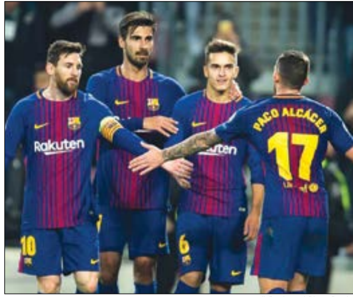
مواجهة سهلة لبرشلونة اليوم