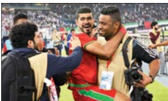
فرحة كبيرة من سعيد الرزوقي

أكد مهاجم عمان سعيد الرزوقي أن الفوز بكأس الخليج لم يكن سهلاً وأتى بسبب الرغبة الكبيرة من جانب جميع اللاعبين في تحقيقه وتقديمه كهدية بسيطة إلى الشعب العماني. ومضى الرزوقي لـ «الأنباء» قائلاً: «لا أستطيع أن اصف شعوري بتحقيق الكأس، مثل هذا الشعب العماني والجماهير التي حضرت إلى مدرجات ستاد جابر يستحقون