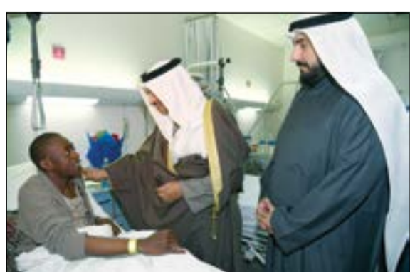
.. ويتحدث مع مشجع آخر