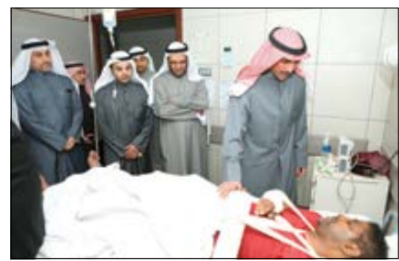
ويطمئن على طفل مصاب