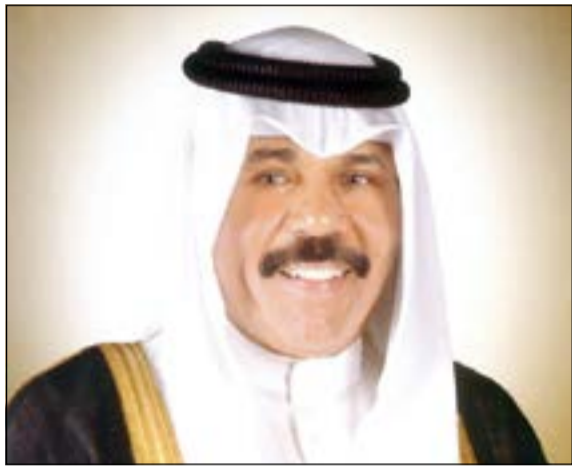
سمو ولي العهد الشيخ نواف الأحمد

والتنظيم والتي ساهمت في إنجاح بطولة كأس الخليج العربي لكرة القدم الـ 23 والتي أقيمت في الكويت خلال الفترة من 22 ديسمبر حتى الخامس من يناير الجاري، مثنياً سموه هذا الإنجاز الرياضي المشرف الذي أدخل البهجة والسرور على الجماهير الرياضية الخليجية الشقيقة والذي جاء نتيجة الجهود الطيبة في نجاح هذه البطولة وخروجها بما يليق بمكانة الكويت إقليمياً ودولياً. كما أشاد سموه بالأداء والمستوى الفني الرفيع الذي قدمه لاعبو المنتخب المشاركة من منافسة شريفة تميزت بروح رياضية عالية، متمنيا سموه للجميع كل التوفيق والسداد لخدمة الوطن الغالي ورفع رايته تحت ظل القيادة الحكيمة لصاحب السمو الأمير الشيخ صباح الأحمد ذخراً للبلاد وقائداً للعمل الإنساني.