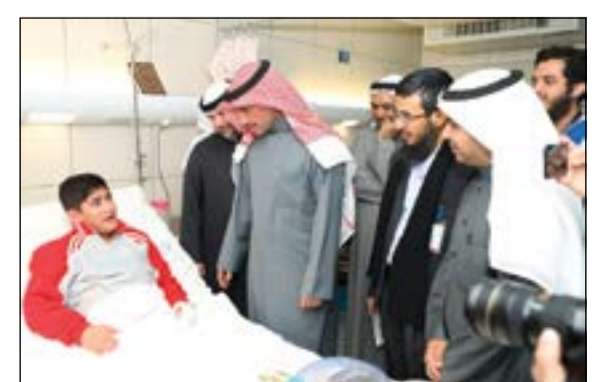
ويطمئن الشفاء لمشجع عماني