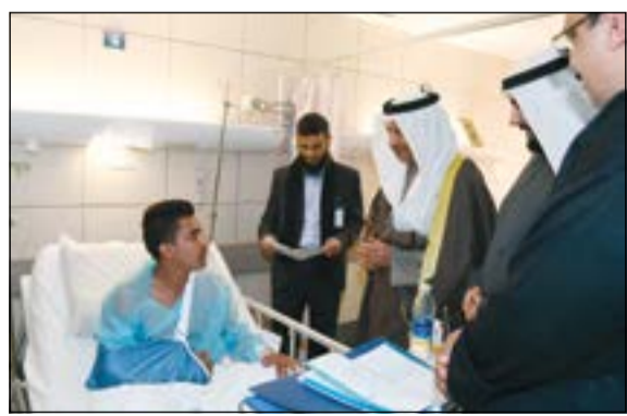
.. ويطمئن على طفل مصاب

وأضاف: نسأل الله سبحانه وتعالى، أن يشفي الجميع، وأن يخرجوا سالمين معافين في أسرع وقت. وتابع لكن الحمد لله اطمأنا انه لا توجد حالات حرجة أو إصابات شديدة وكلها إصابات بسيطة وتم التعامل معها وجار التعامل مع الباقي. واستطرد الغانم، أخواني واخواتي الاطباء والطبيبات