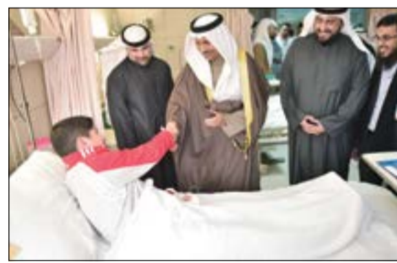
ويدعو بالشفاء لأحد المصابين