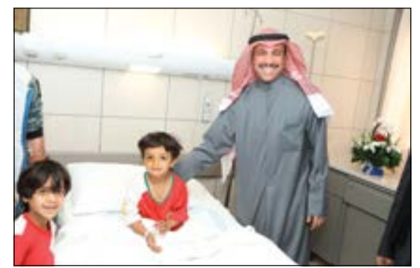
ويطمئن على طفل مصاب