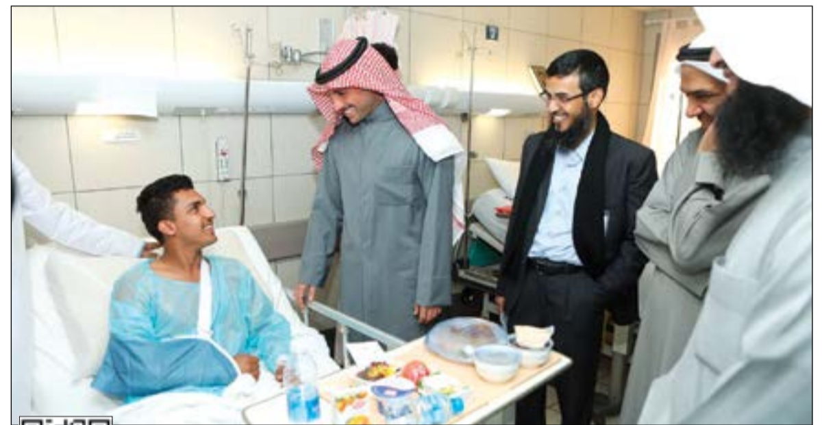
رئيس مجلس الأمة مرزوق الغانم يطمئن على أحد المصابين