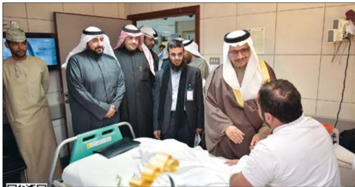
سمو رئيس الوزراء الشيخ جابر المبارك يطمئن على أحد المصابين