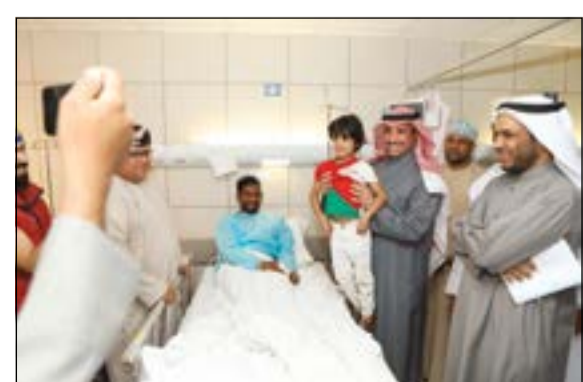
الغانم يحمل طفلاً عمانياً خلال زيارته