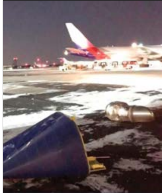
صورة تظهر الأضرار التي لحقت بطائرة «الكويتية»