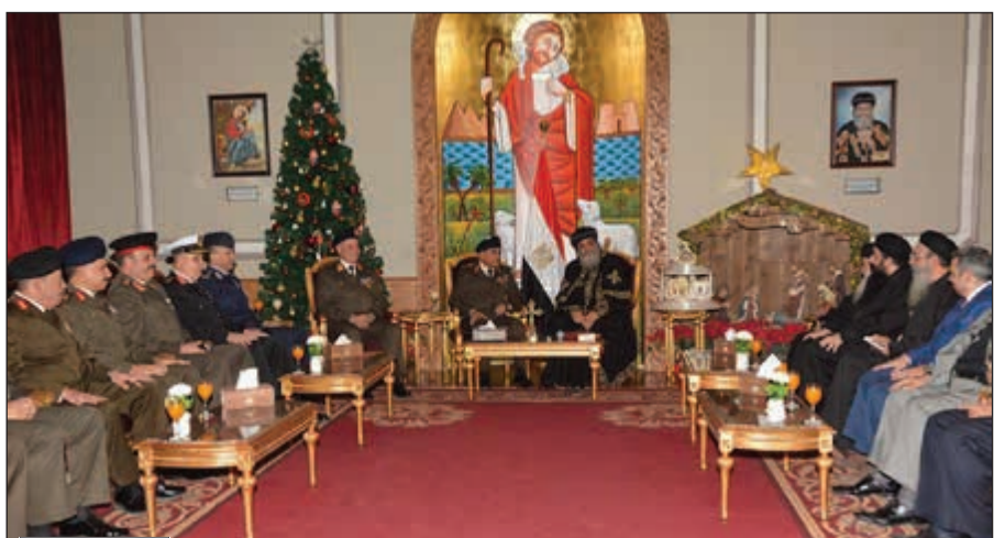
الدفق أول صدفي صبحي والغريق محمد فريد يقدمان التهنئة للبابا تواضروس الثاني بمناسبة عيد الميلاد المجيد