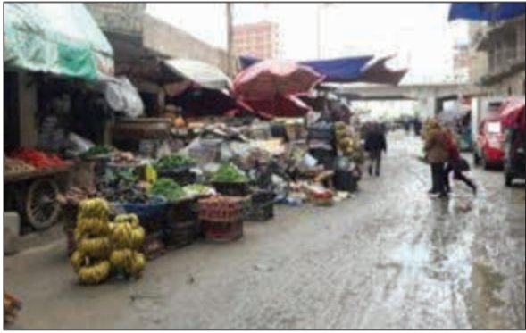
أمطار شديدة في بعض المحافظات