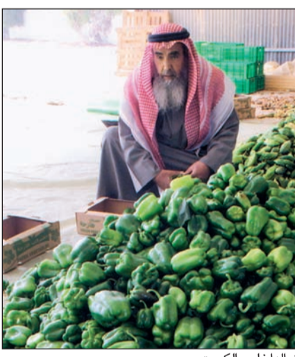
أسعار المنتج المحلي تتراجع في ذروة الإنتاج... فإلى متى؟!

سوق خضار الوفرة يفتقر للتنظيم والنظافة رغم الوعود والعهود 50 ألف متر مربع المزرعة النموذجية وتجزئة المزارع نعمة! نعمة! زراعة الطماطم الحقلية نجت من البرد والصقيع والمطر..