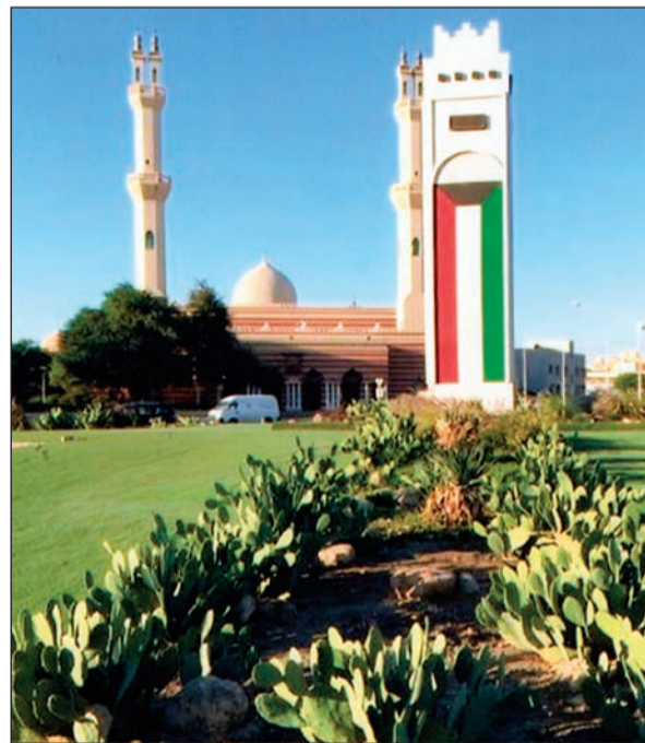
الصبار يزئ دوارات كويتية

ركزت منظمة الأغذية والزراعة للأمم المتحدة (فاو) على أهمية الصبار، وخصوصاً من نوع التين الشوكي (صبار التين الهندي) لأهمية هذه النبتة لمستقبل التغذية والعلف، وقالت المنظمة في بيان أصدرته إثر بحوث أجراها خبراءها إن أجناس أوبونتيا من الصبار لديها الكثير لتقدمه إذا تم التعامل معها كمحصول زراعي لا كعشبة ضارة. وركزت المنظمة على نوع «أوبونتيا فيكوس - أنديا» (صبار التين الهندي) الذي تمنحه قدرته على المقاومة مزايا كبيرة. فمن خلال موجة الجفاف التي ضربت جنوب مدغشقر عام 2015، شكّل الصبار مصدراً رئيسياً للغذاء والعلف والمياه للسكان المحليين وحيواناتهم.. ولدعم موقفاً، نشرت منظمة «فاو» كتاب معلومات في شأن صبار التين الهندي مصحوباً بإرشادات عن «الطريقة الفضلى للإفادة من مزايا النبتة المستخدمة في مأكولات في المكسيك وأيضاً في جزيرة صقلية على صعيد الطبخ».