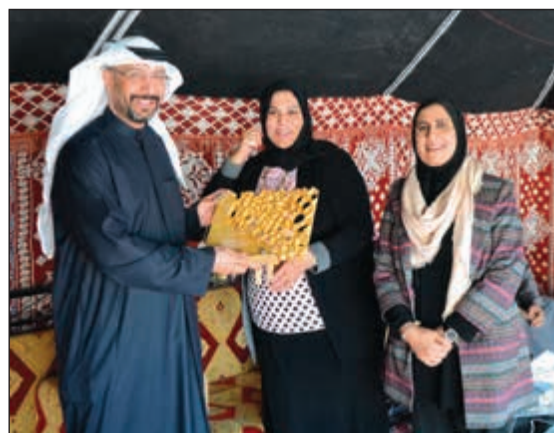
كفاح جمشير تكريم جاسم بوحمند بحضور الهام الشريف

تحت رعاية مدير عام منطقة الفروانية التعليمية جاسم بوحمند وبحضور الأرقام وتتغير أيضاً مدير العملية كفاح جمشير ومدير إدارة الشؤون الهندسية علي الدوسري ومراقب التعليم المتوسط بالإناث أنور الكندري، أقام التوجيه الفني للدراسات العملية بمنطقة الفروانية التعليمية ورش عمل بعنوان «ثمرّة إبداعية» حيث تم افتتاحها بطريقة عرض إلكترونية، ومن ثم تم التحول على أحدث ورش عمل للتدوير والكهرباء والإلكترونيات، وقد أنشأه بوحمند بجهود ممتلئة بالموجهة الأولى الهام الشريف وموجهي وموجهات الدراسات على