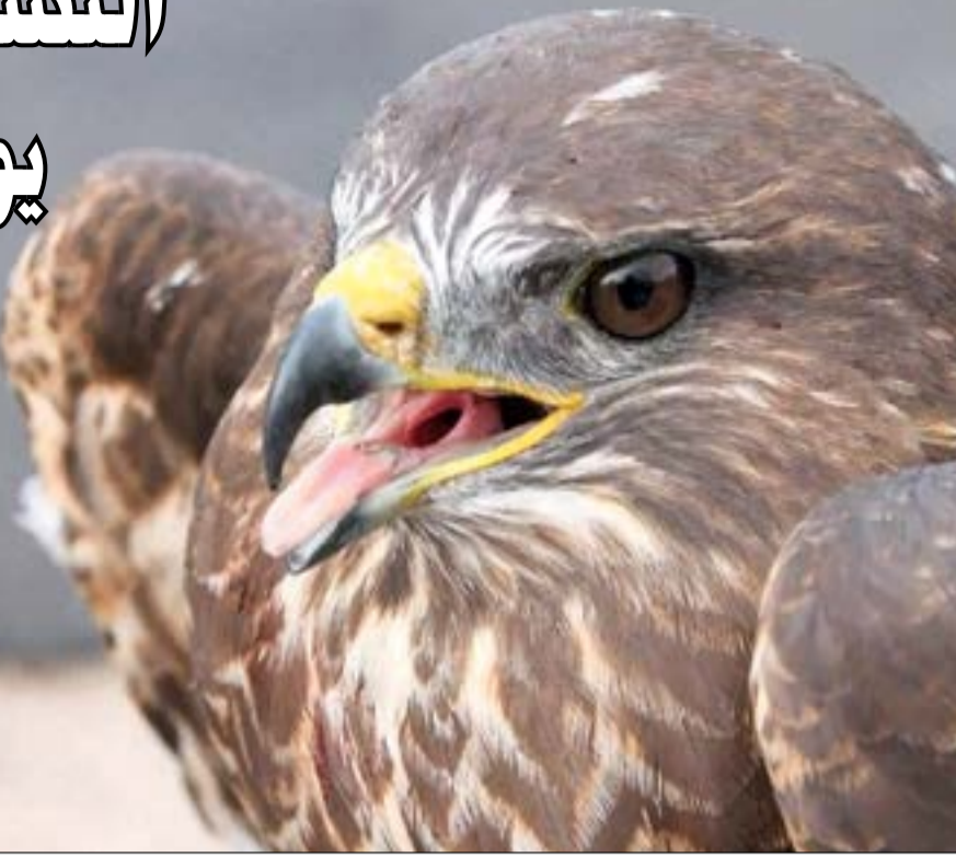
النسر الألباني المهذب بالانقراض