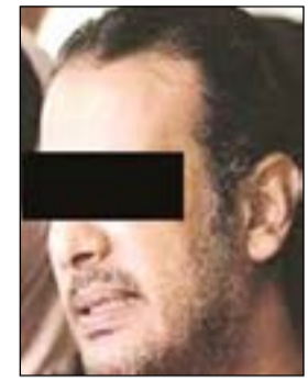
المتهم العائد من الفلبين

وكانت النيابة العامة قد أحالت المتهمين الي المحاكمة بعد ان اتهمت الأول الي الرابع بالانتماء الي تنظيم داعش الإرهابي، والأول الي الثالث بتهم تتعلق بالاتفاق على تصنيع مواد متفجرة ورصد وتصوير مسجد جعفر بن أبي طالب في منطقة الصليبخات، بالإضافة الي كنيسة ومضاييف في منطقة العبدلي، وشرعوا في تصنيع مفرقات بقصدا ارتكاب الجريمة التي أوقفت بسبب لا