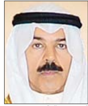
عبد الكريم أحمد

تلقت النيابة العامة أمس بلاغاً من المستشار في الديوان الأميري الشيخ محمد الخالد يطالب فيه بالتحقيق معه حول ما أثير بشأن وجود مخالفات مالية بوزارة الداخلية خلال توليه حقيبته. وقال وكيل الخالد، المحامي عماد السيف إن موكله عن نفسه وبصفته وزيراً سابقاً لوزارة الداخلية، يطلب في البلاغ التحقيق معه بشأن ما ورد من تجاوزات ومخالفات مالية وردت بتقرير ديوان المحاسبة المنشور في إحدى الصحف اليومية خاصة ببنود الصرف