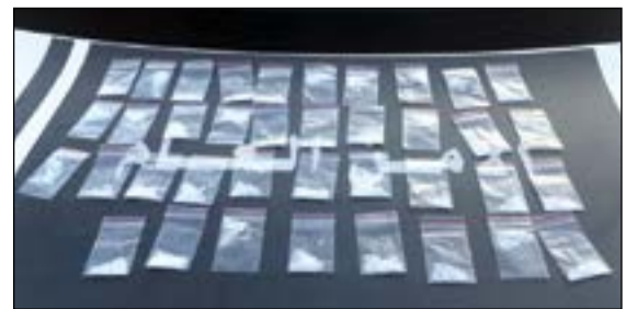
الهيروين المضبوط في الغروانية

بداخله 38 كيس يشتهه بأن بداخلها هيروين. من جهة أخرى، لقي رجال أمن حولي القبض على مواطن ومصري في منطقة الشعب حيث تبين أنهما في حالة غير طبيعية وعثر بحوزتهما على ورق لف وقطعة حشيش وسجارت مستعملة يشتهه بها مادة مخدرة. كما لقي رجال أمن العاصمة القبض على وافد عراقي الجنسية خلال حملة تفتيشية في شرق وعند