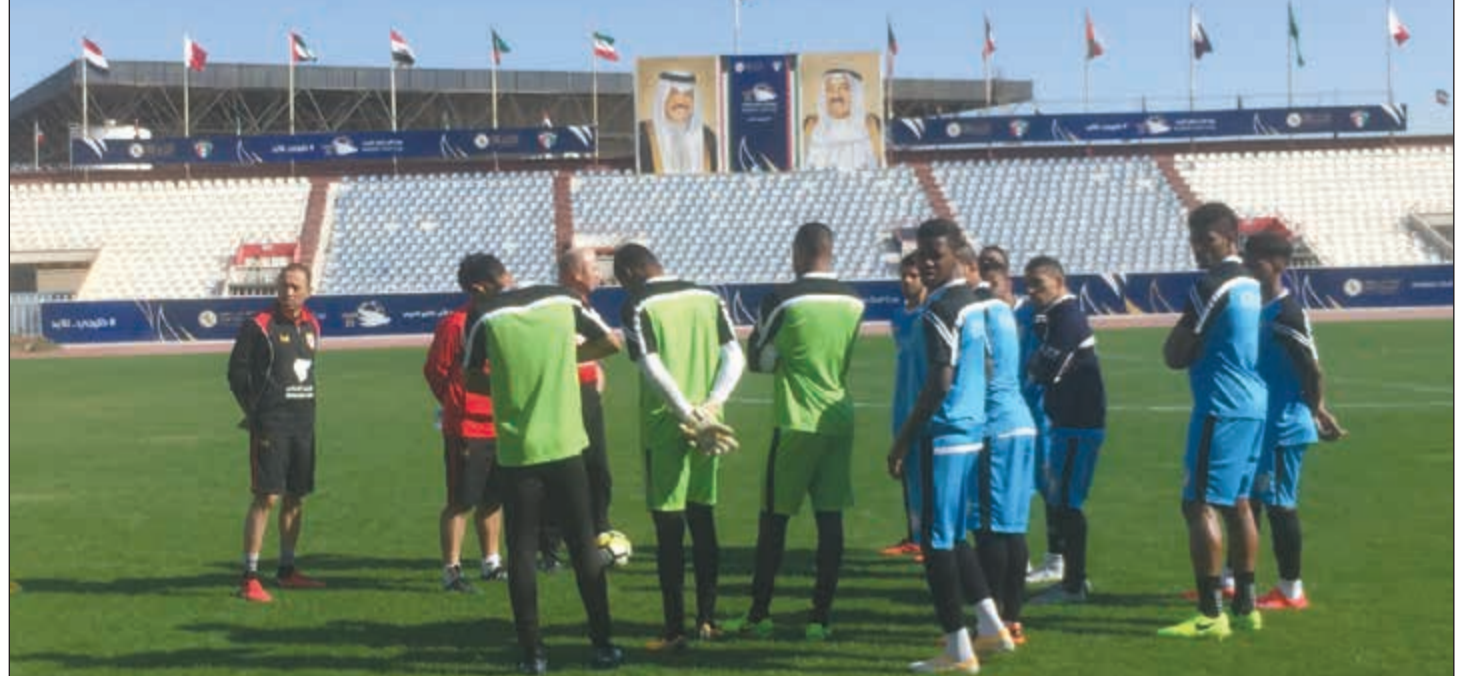
لاعب المنتخب العماني يستمعون إلى توجيهات المدرب فيربيك

إلى النهائي. وأضاف: اعتقد أن الجميع راض عما يقدمه المنتخب من مستوى بدليل تأهله إلى المواجهة النهائية وعن مشاركتي فبقي بيد المدرب وأنا أحترم قراره ورأيه الفني لكنني جاهز متى ما طلب مني المشاركة.