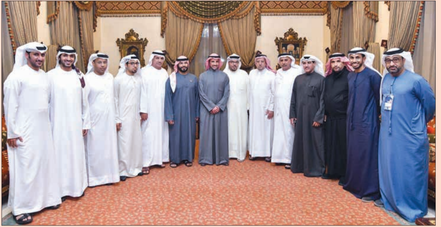
رئيس مجلس الأمة مرزوق الغانم مستقبلا الوفد الإماراتي