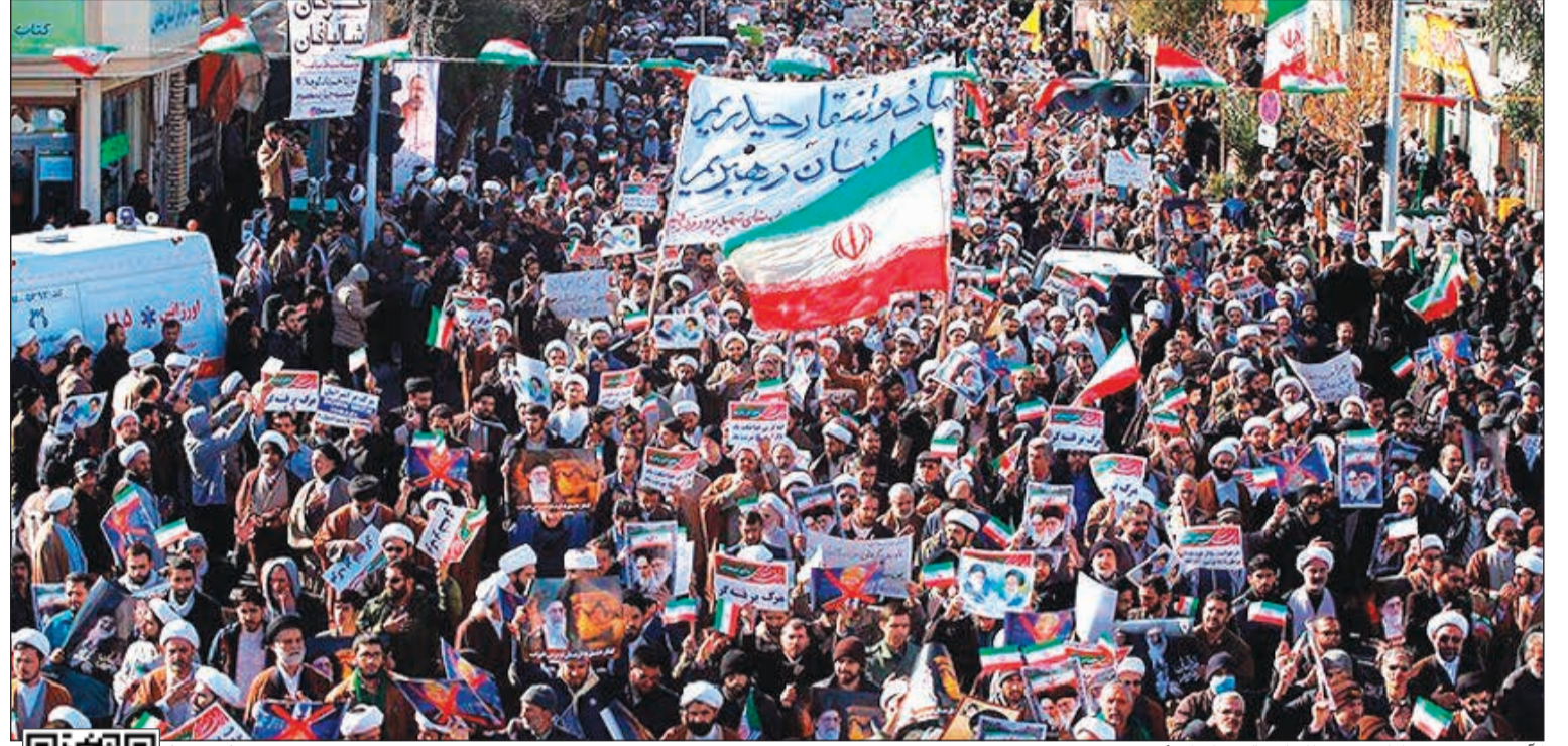
الألاف يرددون هتافات مؤيدة للحكومة في إيران امس

عدم ذكر اسمه «نظر في كل الاحتمالات»، مشيرا إلى أن سلطات الرئيس دونالد ترامب تسمح له باستهداف منظمات أو أشخاص متورطين في انتهاك حقوق الإنسان أو فرض الرقابة أو منع التجمعات السلمية، مضيفا أن ذلك «يطلب معلومات، وهناك الكثير من المعلومات، لذا نعتزم البدء في تجميعها وسنرى ما يمكننا القيام به».