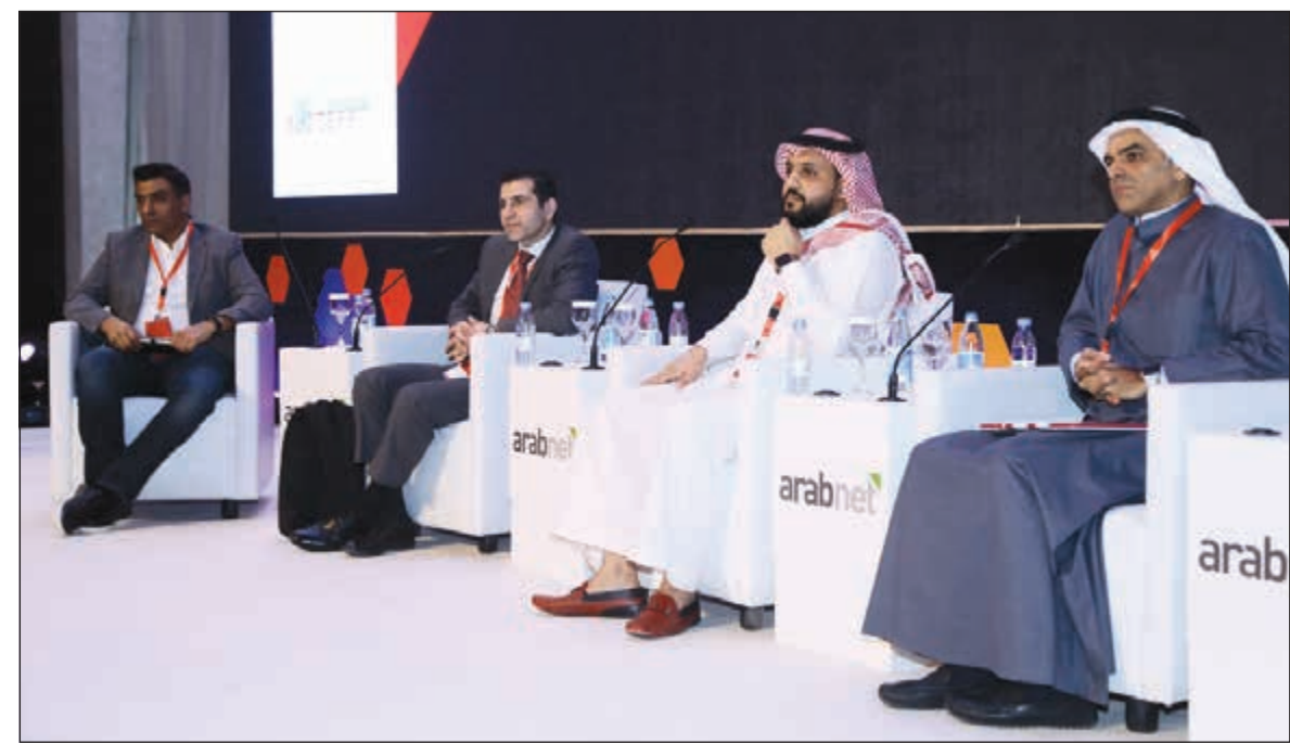
جانب من الحلقة النقاشية