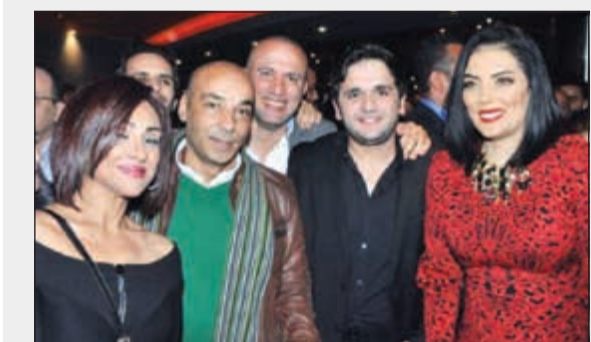
عدد من نجوم الفيلم في العرض الخاص