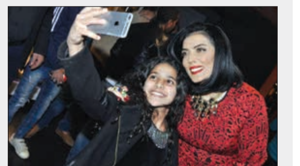
«سيليغي» حورية فرغلي مع معجبة صغيرة