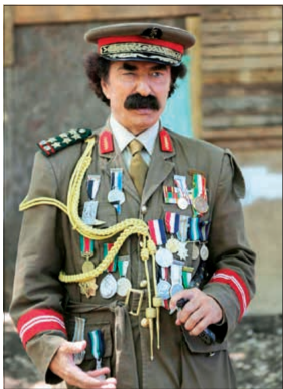
رشيد عساف في أحد ادواره الفنية

كثيراً من وقت الناس، جمهوري يدرك تماماً احترامي له وموقفي تجاهه، لا أكثر ولا أقل.. وبما يشبه الرد غير المباشر أيضاً على ما لحق بها من اقتراءات نشرت الفنانة اللبنانية فيديو من حفلة رأس السنة أيضاً لطفل صعد إلى المسرح لتحتيتها، فما كان منها إلا أن انحنت طابحة قبلة على خده. وأثار مقطع فيديو للإيسا استياء كبيراً بين رواد مواقع التواصل الاجتماعي، وذلك بعد ظهورها وهي تتجاهل سيدة تحاول التقاط صورة تذكارية معها قبل حفلها في دبي ليلة رأس السنة، وأصغها البعض بالغرور والتكبر، وظهر في المقطع المتداول، أن السيدة كانت تنتظر الإيسا عند باب الممر إلى المسرح، وعند دخول الإيسا حاولت المرأة التقاط صورة معها، ولكنها استعملت طريقها دون الالتفات إليها، ثم أبعدها حارسها الخاص.