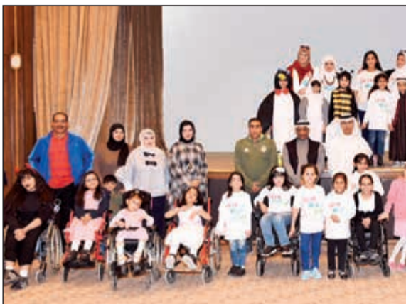
لقطة جماعية للمشاركين في فعاليات اليوم العالمي لذوي الاحتياجات الخاصة

بهذا اليوم العالمي والذي تم تحديده من قبل الأمم المتحدة إنما هو يوم يخص الأصحاء أيضاً، للتفكير ولو قليلاً في ذوي الاحتياجات الخاصة، وذلك في محاولة للمساعدة كل حسب