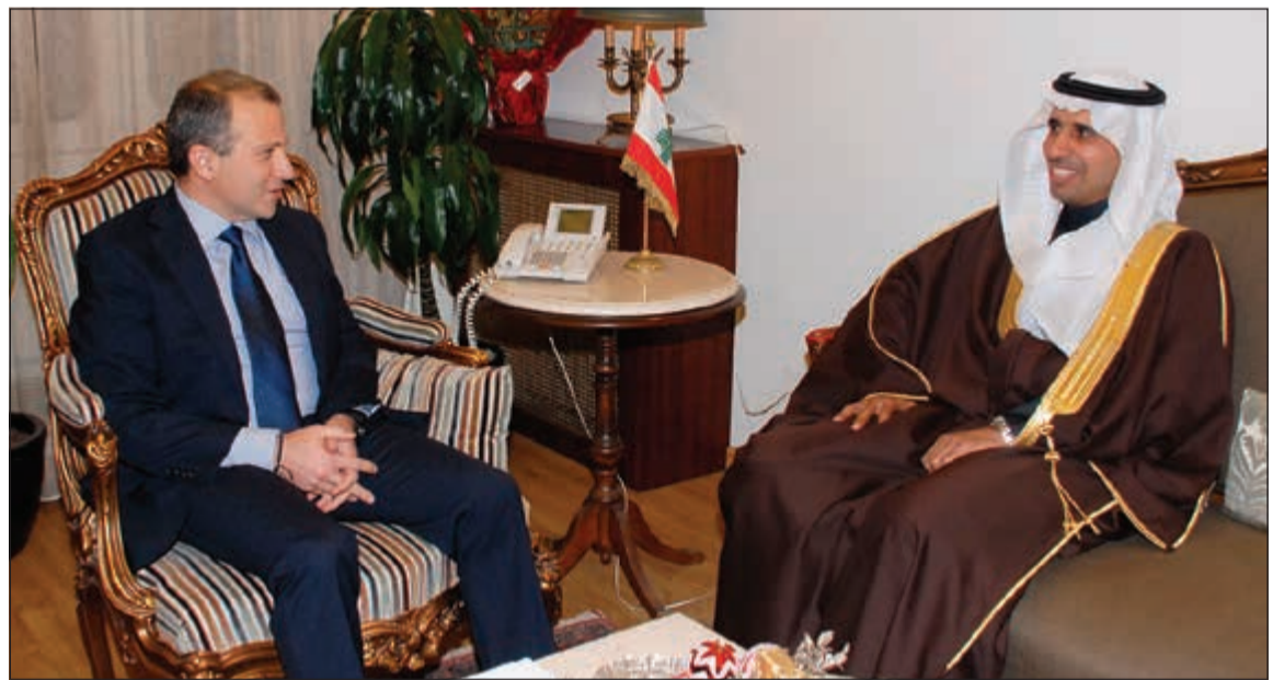
وزير الخارجية جبران باسيل مستقبلاً السفير السعودي الجديد وليد اليقوب (محمود الطويل)

بهذا التحالف. وعلى ذلك، بات من شبه المؤكد انه لم يعد من الممكن يمكن البناء عليه من التيارات الحرة وحركة أمل، ولا بين التيار الحر والقوات اللبنانية، ولا - إلى حد ما - بين القوات اللبنانية ونيابا المستقل، كما ان الاصرار الكلامي على اجراء الانتخابات في الموعد المقرر (6 مايو المقبل) فيه مكابرة اكثر مما فيه واقع وحقيقة، والاوساط الدبلوماسية المتابعة للاوضاع في لبنان