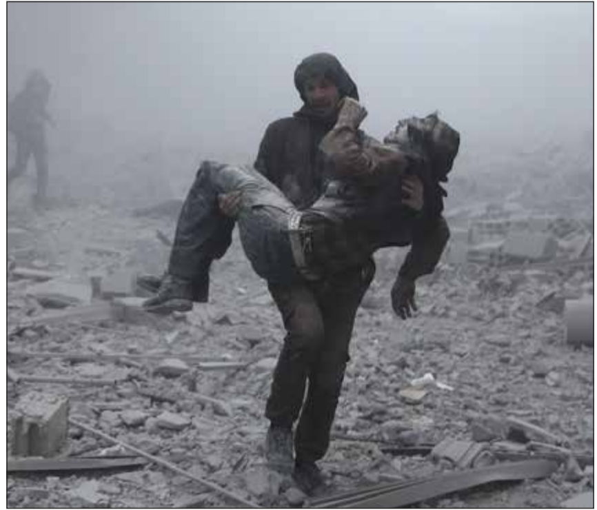
سوري يحاول إنقاذ جريح نتيجة الغارات على عربين في ريف دمشق أمس

من جهته، أفاد مدير المرصد السوري لحقوق الإنسان، بيان الغوطة الشرقية شهدت أمس غارات مكثفة تركزت في مدينتي حرسنا وعربين، ورصد المرصد 11 غارة استهدفت مدينة عربين، بالترزامن مع 15 غارة استهدفت مناطق في مدينة حرسنا، فيما استهدفت 4 غارات مناطق في بلدة مديرا، ما أسفر عن مقتل 3 مدنيين هم طفلان ورجل، وإصابة نحو 30 شخصاً بجراح، بينهم أطفال 42 على الأقل بينهم 11 طفلاً و4 سيدات، وعدد القتلى الذين قضاوا جراء القصف الجوي والدفعي والصاروخي على مدن وبلدات في الغوطة الشرقية منذ السبت الماضي. إلى ذلك، طلبت قاعدة حميميم العسكرية الروسية من جيش النظام «التصدي بحزم» لمسلحي المعارضة في مدينة حرسنا، وقال المتحدث الرسمي باسم قاعدة حميميم الكسندر إيفانوف عبر مواقع التواصل الاجتماعي التابعة للقاعدة أمس الأول: «نأمل من قوات الحرس الجمهوري، إبداء المزيد من الجدية في التصدي للهجمات الإرهابية في منطقة حرسنا التي تشهد نزاعاً دمويًا منذ بداية الصراع في سورية».