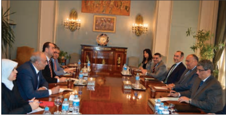
وزير الخارجية المصري سامح شكري مستقبلاً وفد المعارضة السورية برئاسة نصر الحريري

استقبل وفدا من «الهيئة العليا» و«منصة القاهرة» شكري يؤكد الانفتاح على أي مبادرات تدعم «جنيث» والمعارضة متمسكة بهيئة انتقالية كاملة الصلاحيات