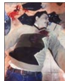
جثتا ضحيتي الإرهاب الغادر في الساعات الأولى من العام الجديد

منطقة الصحراء الغربية مركزاً للعناصر التكفيرية لقرئها من تنظيم «فجر ليبيا» للحصول منه على الدعم اللازم لضمان نجاح العمليات الإرهابية تحت مسمى المسار الثوري. هذا، وقد استعانت النيابة بخبراء الإذاعة والتلفزيون لمشاهدة تفريغ الأحداث التي بثتها كاميرات كنيسة مار مينا، حيث أظهر التسجيل الإرهابي وهو يستقل دراجة بخارية ويرتدي خوذة على