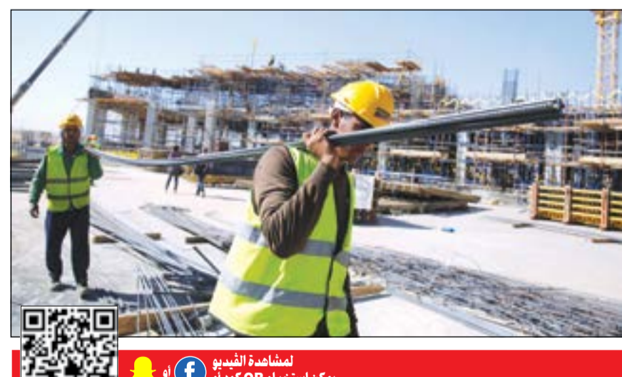
المشاهدة الفيديو يمكن استخدام QR كود أو

شهدت السياحة تعافياً متزايداً على مدار العشرة أشهر الأولى من العام 2017، إذ صعدت السياحة الأجنبية في مصر بنسبة 54,57% على أساس سنوي، وبلغ عدد السياح الوافدين في الفترة من يناير إلى أكتوبر من العام 2017، نحو 6,720 ملايين سائح، مقابل 4,347 مليوناً سائح عن الفترة نفسها من العام 2016، وفقاً لبيانات وزارة السياحة، وقد قفزت إيرادات مصر من السياحة بنسبة 195% خلال العشرة أشهر الأولى من 2017 على أساس