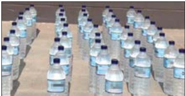
قناني الخمر تم التحفظ عليها تمهيدا لإتلافها

حالة غير طبيعية وعثر معه على الممنوعات. وفي منطقة السالمية، ضبط وافد هندي الجنسية وبحوزته 42 بطلا محليا وأحيل على إثرها للحجز.