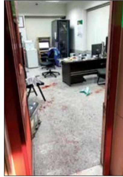
مكتب ادارة المحطة الذي شهد محاولة السرقة