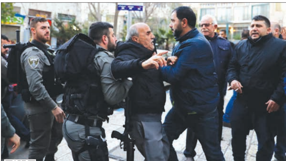
عناصر من قوات الاحتلال يعتقلون فلسطينياً خلال تظاهرة في القدس الشرقية أمس الأول