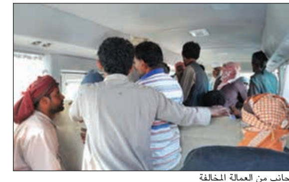
جانب من العمالة المخالفة