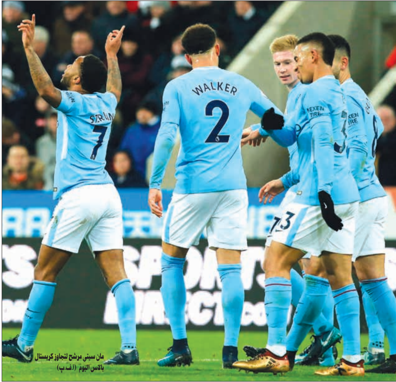
مان سيني مرشح لتجاوز كريستال بالاس اليوم (أضرب)

الأساسي (0-1 على أرضه) ثم تعادله بين جماهيره مع فيورتينا (0-0). ورفع فريق المدرب ماوريتسيو ساري رصيده إلى 48 نقطة. وسجل للفريق الجنوبي الحالم بلقبه الأول منذ 1990، قائدته وهدافه التاريخي السلوفاني ماريك هامسيك الذي وجد طريق الشباك للمباراة الثالثة على التوالي.