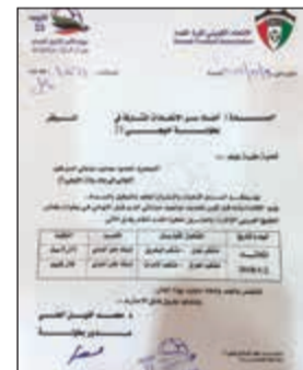
كتاب مواعيد نصف النهائي

حددت اللجنة الفنية في البطولة موعد وتوقيت إقامة مباراتي الدور نصف النهائي للبطولة، حيث ستقام المباراة الأولى بين منتخبي عمان والبحرين في