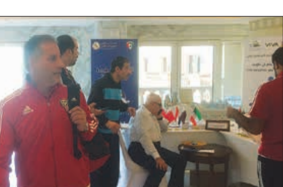
عدد من الحكام في مقر إقامتهم في فندق ريجنسي

● يتم اختيار الطاقم وفق قرار اللجنة بعد دراسة ظروف المباراة ومعطياتها، كما أن اللجنة كانت حريصة منذ البداية على تجنب الطاقم الاتحادي الدولي للعبة، موضحاً أنه لا بد من الإشارة إلى أن الحكم الخليجي دائماً ما يكون تحت الضغط وهي معاناة نحرض على تجاوزها عبر الارتقاء بجميع حكامنا وتوجيه الانتظار نحو إدارة المباراة فقط.