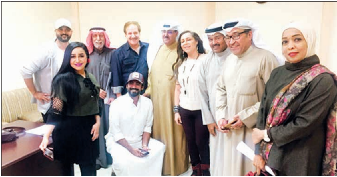
فريق «بنقول لكم سالفة» يتوسطهم المبارك