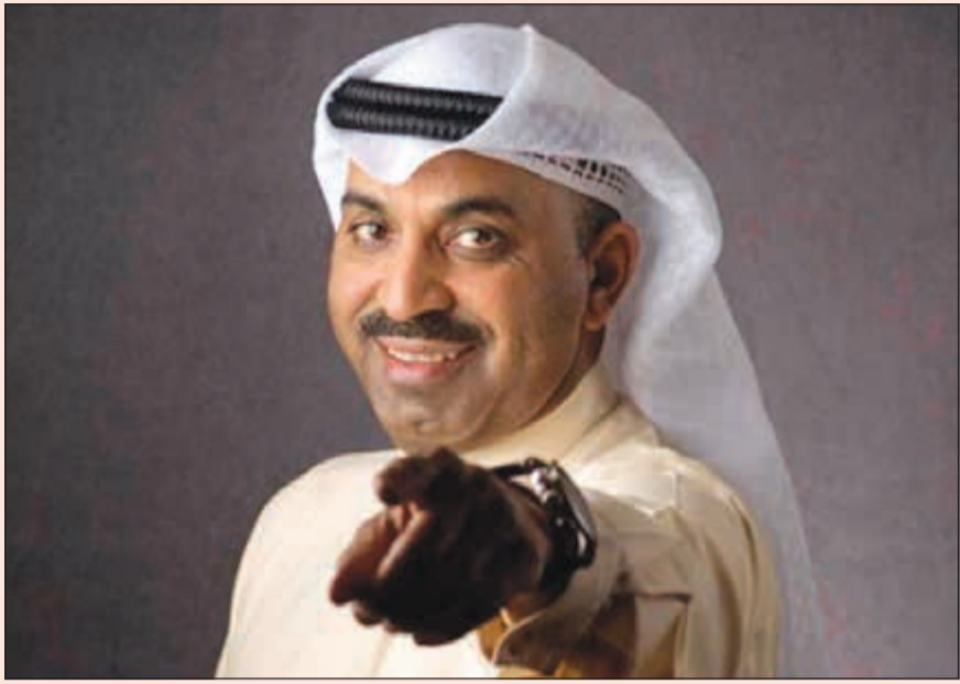
النجم طارق العلي

وثمن الفنان الكوميدي القدير طارق العلي مشاركته للإعلامية حليلة بولند لتقديم البرنامج الرياضي «خليجنا باقي» الذي يعرض يوميا على شاشة atv واصفا ان البرنامج بوجبة خفيفة يستضيف عددا من نجوم الفن للحديث عن المنتخبات المشاركة في دورة كأس الخليج الـ 23 التي نظمتها الكويت لفرحتها برفع الإيقاف الرياضي عنها.