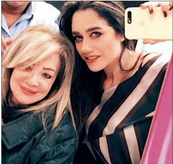
الصورة التي ظهرت فيها شهيرة من غير حجاب

تعرضت الفنانة شهيرة للعديد من الانتقادات والهجوم بعد انتشار صور لها عبر «انستغرام»، وظن البعض أنها خلعت الحجاب بسبب ظهورها في الصورة مع خبيرة التجميل راندا عبدالسلام بدون حجاب. وردت شهيرة بعد الهجوم المتكرر عليها عبر صفحتها «فيسبوك»، قائلة: «أنا كنت عند الكوافير وطلبت مني بنت لطيفة صورة سيلفي عادي يعني، فوجئت بنشرها على انستغرام بشعري والدنيا قامت.. أنا والله لسة محتشمة». وفي التعليقات أكدت الفنانة أن الأمر لا يتعلق بارتدائها الحجاب من عدمه، وإنما بامانة التصرف وأنه كان على الفتاة أن تستأذنها قبل نشر الصورة.