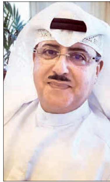
الشيخ فهد المبارك