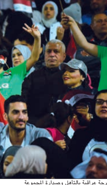
جمامير البحرين احتفلت بالتأهل (هاني الشمري)