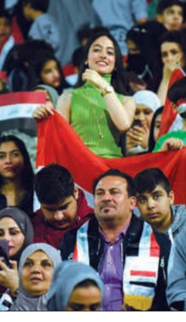
جمامير البحرين احتفلت بالتأهل