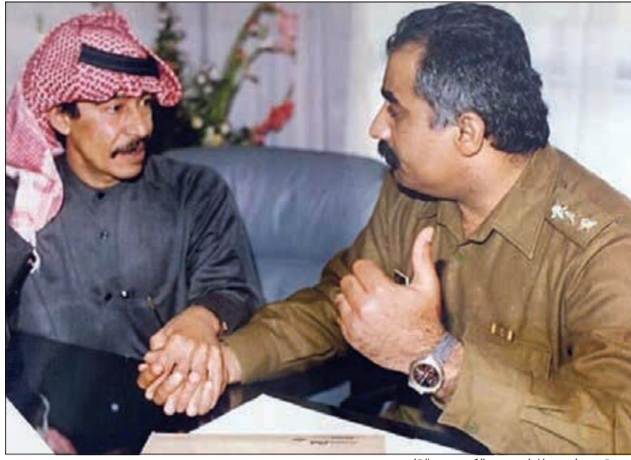
في مقر عمله مع المطرب عبدالكريم عبدالقادر

يذكر أن المطربة مي فاروق تعتبر واحدة من أجمل الأصوات على الساحة الغنائية، حيث تجيد تقديم أغاني طربية عديدة لعالمة الفن العربي، من خلال مشاركتها في حفلات دار الأوبرا المصرية، كما أصدرت عددا من الأغاني الخاصة وأغاني المسلسلات.