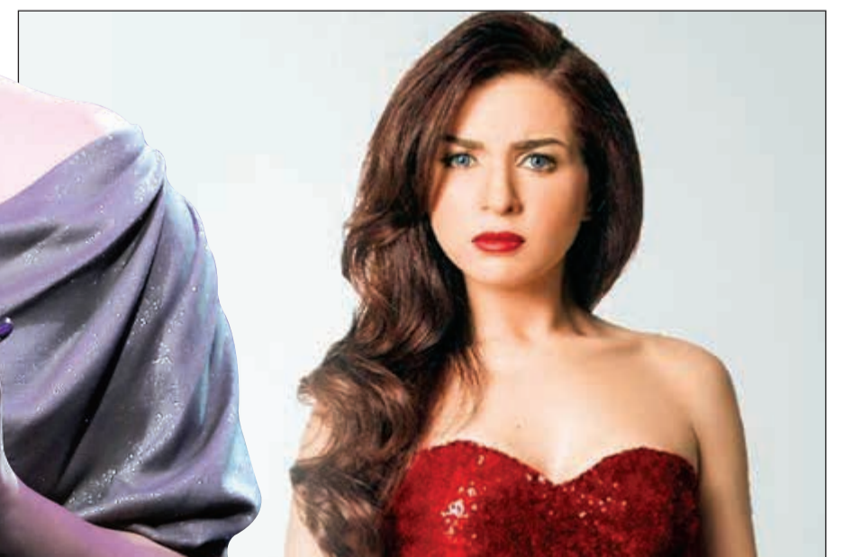
مي عز الدين

يبدو أن الشائعات التي طاولت النجمة مي عز الدين حول «الفوتوشوب» التي خضعت له صورتها الأخيرة، وذلك بعدما لاحظ المتابعون نحافة خصرها، وشككوا في رشاقتها، استمرت عز الدين، وهو ما دفعها إلى الرد على كل تلك الشائعات، وذلك من خلال نشر مقطع فيديو لها وهي في غرفة نومها وأمام المرآة، معلقة: «الحمد لله وسطي مطلعش فوتوشوب، كنت قلقانة قوي يطلع فوتوشوب، مش عارفة كنت هعيش إزاي، أتجوز جرافيك بديانر عشان يعمل فوتوشوب طول ماحنا ماشيين في الشارع عشان الناس متفكسينش، ولا كنت هعمل إيه، يلا الحمد لله جت سليمة، مشوا الناس النفسية دي من هنا، فيه دخلاء وسطنا يا جماعة، ولا أقولكم أحنا نقفل عليهم الآوننت بالليل ونظبطهم».