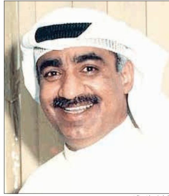
الراحل راشد الخضر