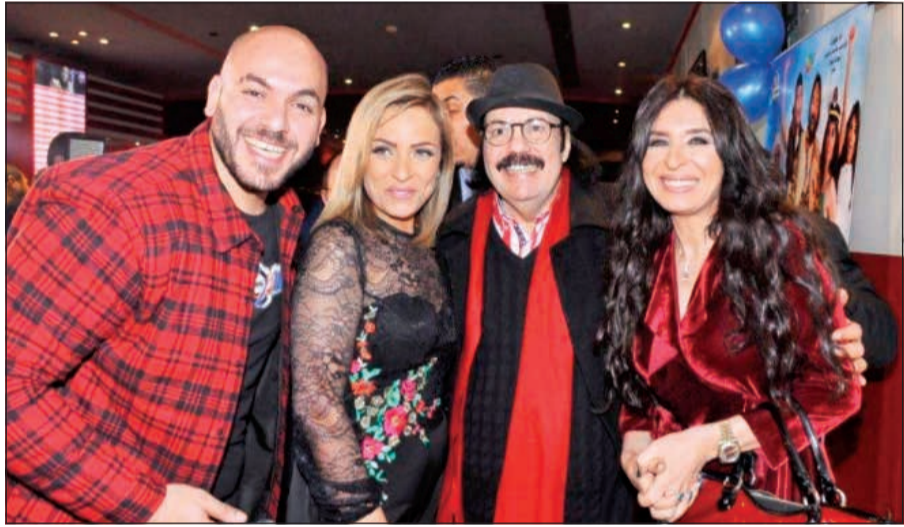
ابطال الفيلم في العرض الخاص

هبة السيسى لارتدائها مايوه مثيرا، كما صنفت الرقابة الفيلم لمن هم أكبر من 12 عاماً.