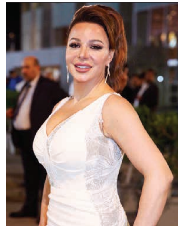
سوزان نجم الدين

انتقدت الفنانة السورية سوزان نجم الدين «السوشيال ميديا» مؤكدة أننا أصبحنا نعيش في حالة الزيف والبعد عن الحقائق، وقالت خلال لقائها في برنامج «وياكم مع سعيد» مع الإعلامي سعيد الشهرانى والمذاع عبر فضائية «الظفرة»: «السوشيال ميديا» خربت حياتنا، وأصبحنا ممثلين في الحياة، ولا يوجد لأحد أي خصوصية ووضعنا كل أسرارنا أمام العدو وسهلنا عليه طرق التجسس، مضيضة: من المذهل أيضا أن بعض المنتجين حاليا باتوا يحددون قيمة وأهمية الفنان من عدد متابعيه على صفحته، و«السوشيال ميديا» أثرت بشكل سلبي وعن الحب والزواج، قالت: أحلى شيء في الحياة بشكل عام، وشيء جميل أن تجد امرأة الحب الذي يسيطر عليه التقامم والاحترام ويكون شريكا حقيقيا، الحب أكبر نعمة في الدنيا، وأتمنى أن أجد الشريك المناسب وسبق أن فكرت في الزواج ولن أتردد في هذه الخطوة بمجرد أن أجد الشخص المناسب.