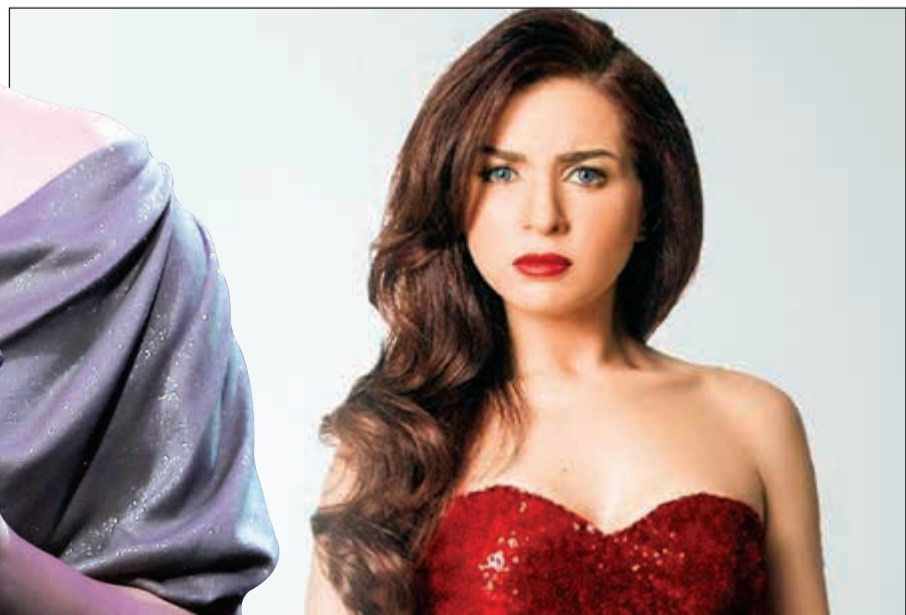
مي عز الدين

بالليل ونظبطهم». وتابعت: «معلومة بس علسان الفقرة الثانية اللي هيدخلوا فيها، من الآخر كده وخديها تجميل ولا نحتي جسمك لو محافظتيش على أكلك وعشتي على دايت مطلوب وتعبتي إنك تحافظي عليه برضه مش هيبقي شكل جسمك كده، والله جيتي جيرانك وشارعك كله ينحت فيكي برضه ريجي نفسك، إنتي أقفلي بقك بس من الأكل والتعليق على الممثلات وخلق الله عموما، وكله هيبقي تمام بإذن الله ربنا هيكرمك آخر كرم».