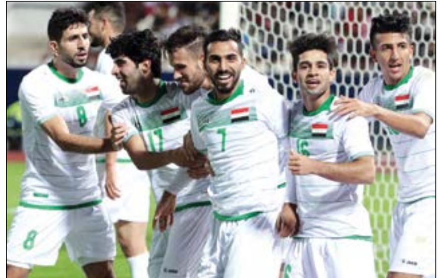
لاعب العراق يسعون للاستمرار في البطولة