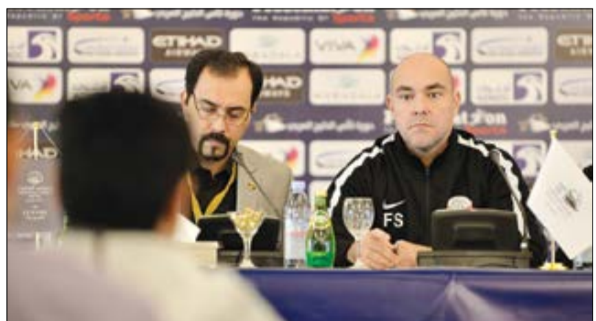
مدرب قطر فيليكس سانشيز يجيب على اسئلة مراسلي الوسائل الاعلامية

في الشوط الاول حيث ضغط وحاول الوصول للمرمى لكنه لم يتمكن