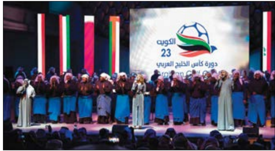
لوحة تراثية تغنت بحب الكويت والخليج