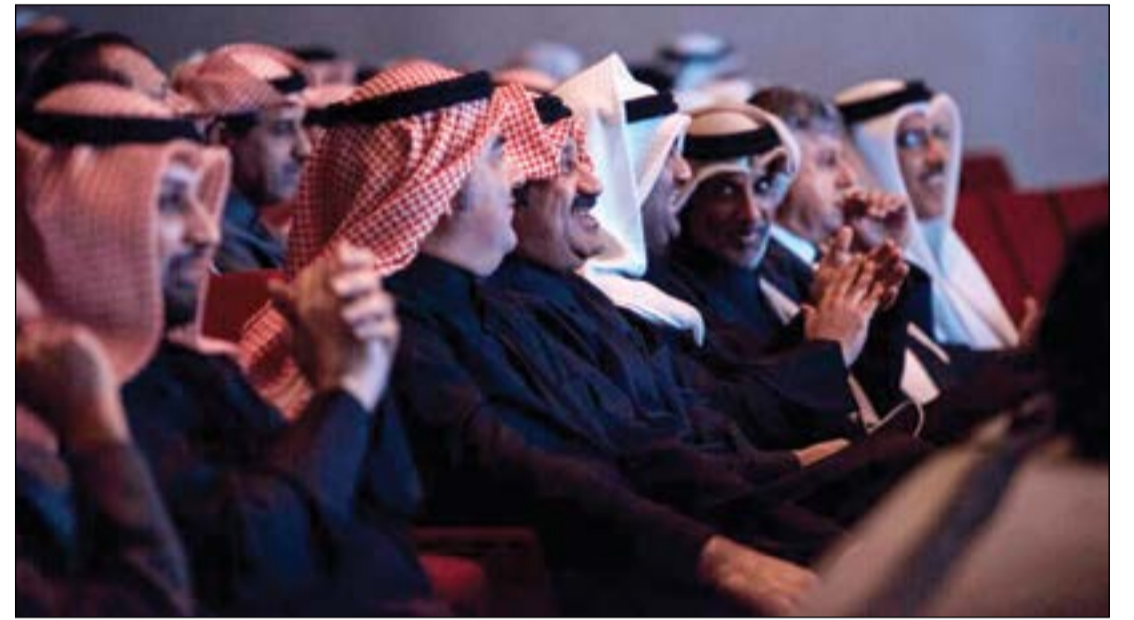
الوزير خالد الروضان والشيخ احمد اليوسف مع كبار الحضور

وأضاف الصالح في تصريح صحفي أن إقامة هذه الدورة واستمرارها على ارض الكويت يعد فرصة كبيرة لتواصل الشباب الخليجي ولقائهم وتنافسهم في واحدة من أكثر الرياضات شعبية. وأشاد بما تتحلى به الفرق الخليجية من روح رياضية وتنافس شريف وشعور بالمسؤولية يعكس حرصا كبيرا على انجاح هذه الدورة وادراكا لاهدافها ومقاصدها النبيلة، لاسيما تعزيز التواصل وزيادة اللحمة بين الشباب والشعوب الخليجية.