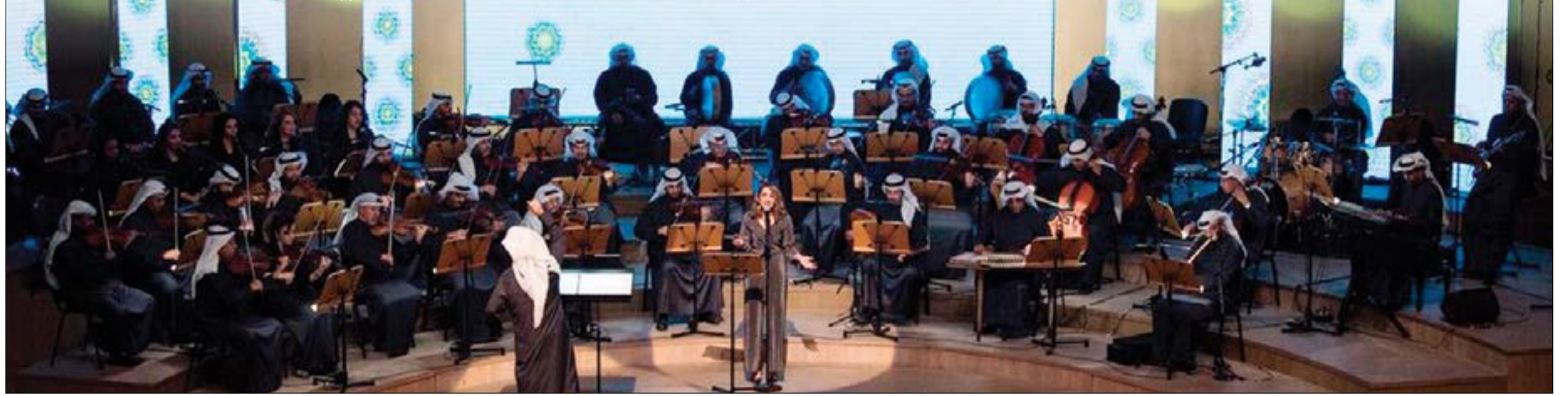
فقرات ولوحات موسيقية شعبية ألهمت حماس الحضور في دار الأوبرا

حفل عشاء أقيم على شرف الوفود المشاركة بحضور الروضان