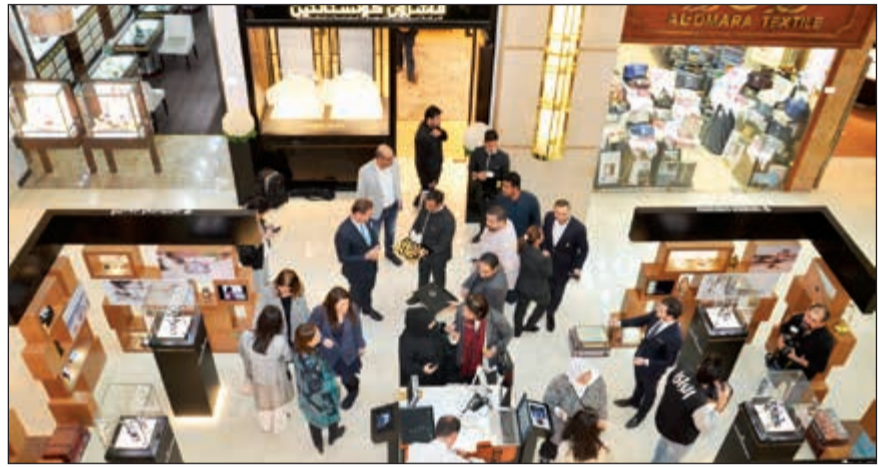
إقبال كبير على منتجات «فاشرون كونستانتين»

تدعوكم «فاشرون كونستانتين» إلى التعرف على ثراء وجمال الشرق الأوسط من خلال ساعات «أوفر سيز» الحصرية للمنطقة، تحفي هذه الأخيرة بالسفر وتنوعه ومساهمته بالإنفتاح العالمي، وبكوين الشخصيات ويعيش تجارب جديدة، تتألف مجموعة أوفر سيز الخاصة بالشرق الأوسط من نماذج صغيرة وكروغرافية، باللون البني والذهب الوردي المستوحاة من الرمال الصحراوية، والأودية وأشعة الشمس الساطعة.