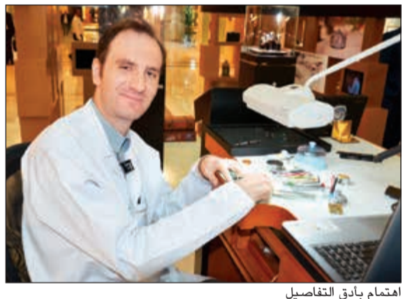
اهتمام باثق التفاصيل