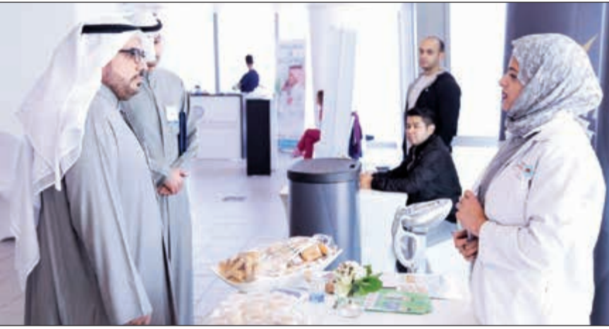
جانب من اليوم الصحي في بنك وربة

ويضفي جوا من الود والألفة والتعاون في بيئة صحية. يقع بنك وربة في الكويت، وهو بنك إسلامي أنشئ بموجب مرسوم أميرى، وقد تم تسجيله رسميا في سجل البنوك الإسلامية ببنك الكويت المركزي في 5 إبريل 2010، ويقدم بنك وربة مجموعة كبيرة من الخدمات والحلول المخصصة والمتوافقة مع الشريعة الإسلامية والتي تتوافق من خلال مجموعات العمل الأربع التابعة للبنك: مجموعة الخدمات المصرفية للأفراد، ومجموعة الخدمات المصرفية للشركات، والمجموعة المصرفية للاستثمار ومجموعة الخزينة.