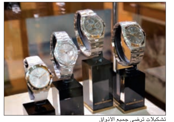
تشكيلات ترضي جميع الأذواق

كما ان ساعات هذه المجموعة هي نتيجة العمل الدؤوب لفريق متعدد التخصصات والذي يضم مصممين، مهندسين ميكانيكيين، مهندسي الميكروميكانيكية وخبراء صناعة الساعات. فقد تولوا معا تحويل الإنجازات الجريئة في صناعة الساعات إلى تكنولوجيا متطورة محافظة على قيم الدار السويسرية، وتعتمد الساعات على الخبرات الفنية والحرفية، أما الخبراء في مادة المينا، النقش والأحجار الكريمة في فاشرون كونستانتين فيتقنون مهنتهم بامتياز ويرتبطون ارتباطا وثيقا بتراث الدار.