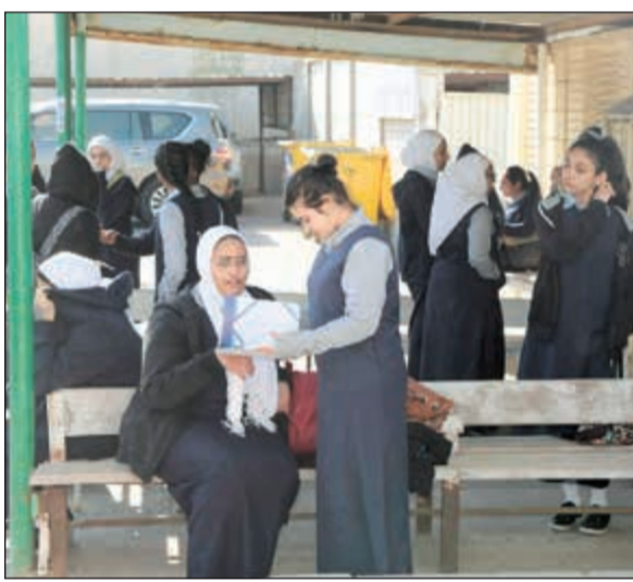
طالبات بعد نهاية الاختبار