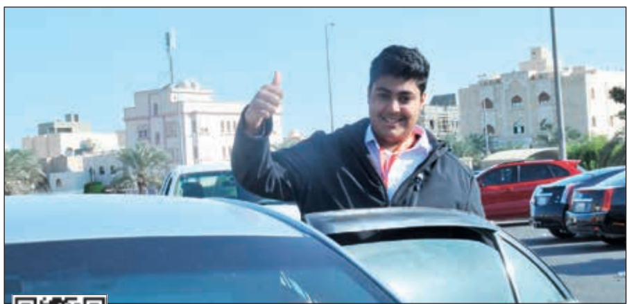
أحد الطلبة سعيداً بمستوى الاختبار