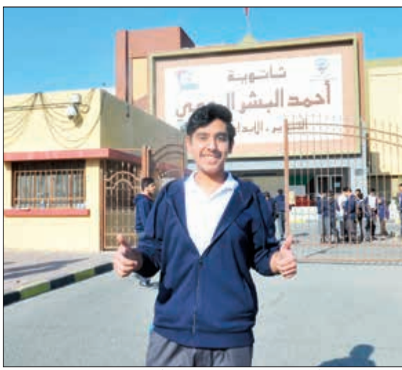
أحد طلبة ثانوية أحمد البشر الرومي فرحاً بعد أداء الاختبار (زين علام)