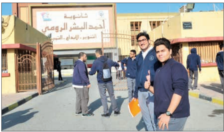
عدد من طلبة ثانوية أحمد البشر الرومي

أدى طلبة المرحلة الثانوية أمس اختبارهم الثاني لنهاية الفترة الدراسية الأولى، حيث قدم طلبة الثاني عشر الأدبي امتحان الفلسفة، بينما كان اختبار الكيمياء لطلبة العلمي. وأكد عدد من الطلبة لـ «الأنباء» أن اختبارات أمس