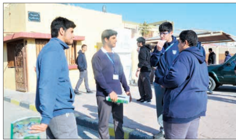
حوار حول الاختبار بين مجموعة من طلبة الثانوية